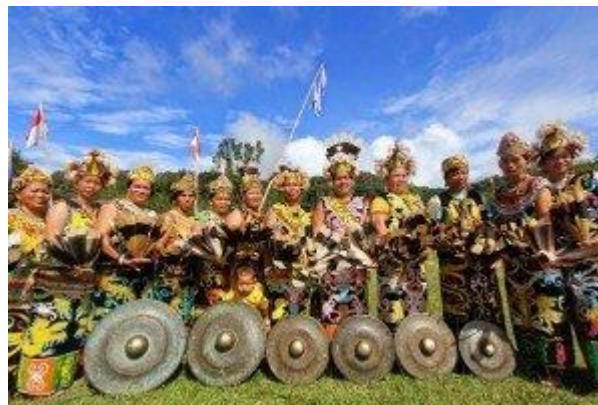
Gambar 1. Tari Gantar [10]