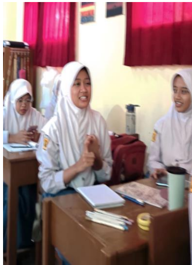
Gambar 2.2 Diskusi tanya jawab