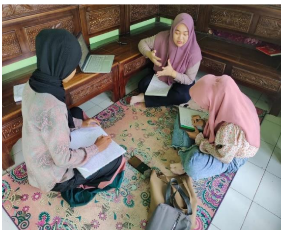
Gambar 1.1 Pembuatan materi