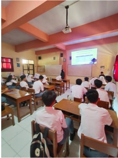
Gambar 2.1 pemaparan materi