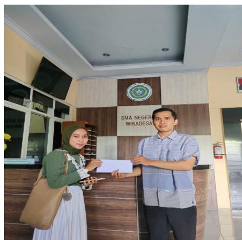
Gambar 1.2 Pengajuan perizinan