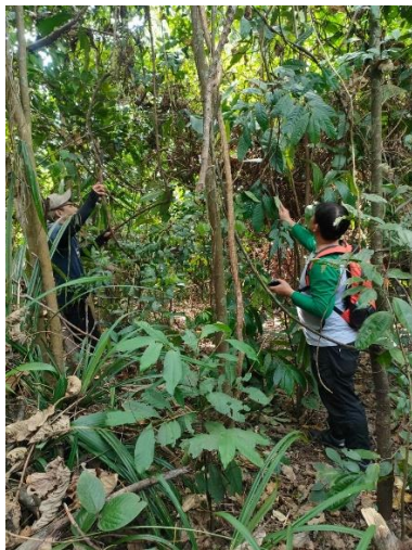
Gambar 1. Identifikasi

saat ditemukan terdapat satu individu sudah mulai berbunga. Berikut disampaikan identifikasi (Gambar 1), bentuk daun (Gambar 2) dan bunga (Gambar 3)