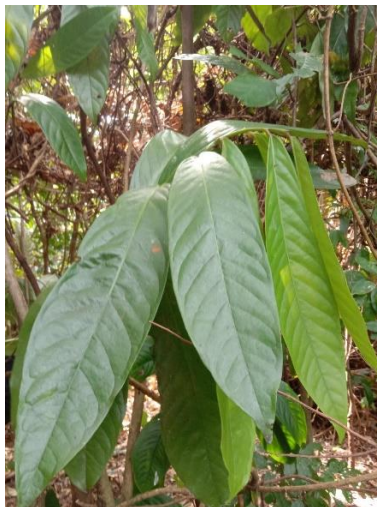
Gambar 2. Bentuk Daun