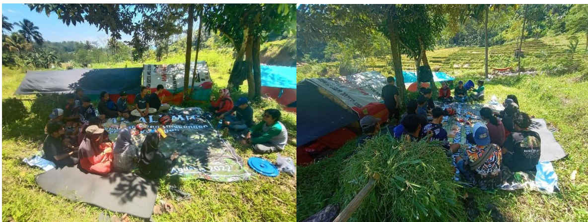
Gambar 4. Kegiatan Sosialisasi

Factor (TNF)- \alpha inhibitor, diantara ke-28 tumbuhan obat tersebut yang mempunyai (TNF)- \alpha inhibitor tertinggi adalah batang Avicennia sp. dan daun G. macrophyllus (Batubara et al. 2012). Penyampaian mengenai keberadaan Tendani ( Goniothalamus macrophyllus ) serta manfaatnya sebagai tumbuhan berkhasiat obat dengan Bahasa yang sederhana dan mudah untuk dicerna. Kegiatan dilakukan kepada anggota kelompok tani hutan Tilu Daun disampaikan pada tempat terbuka dilokasi kebun/lahan mereka di perbatasan dengan kawasan hutan Gunung Tilu, dengan suasana santai dan penuh keakraban, hal ini untuk lebih mencairkan suasana dan tidak mengganggu aktivitas masyarakat. Anggota kelompok tani hutan Tilu Daun merupakan kumpulan anak-anak muda yang tergerak untuk membangun desa melalui pertanian dengan konsep yang baru dan ramah lingkungan. Pengetahuan mengenai Tendani ( Goniothalamus macrophyllus ) belum banyak didapat, sehingga sosialisasi ini merupakan tambahan ilmu pengetahuan mengenai kekayaan sumberdaya alam yang ada disekitar kawasan hutan Gunung Tilu. Disampaikan kegiatan sosialisasi melalui Gambar 4.