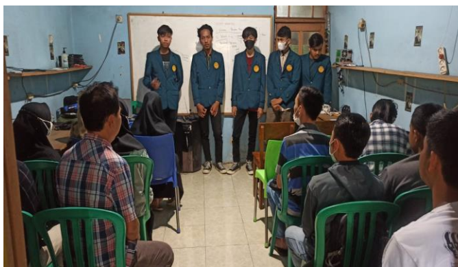
Gambar 5. Kegiatan Pertemuan 3 dan 4