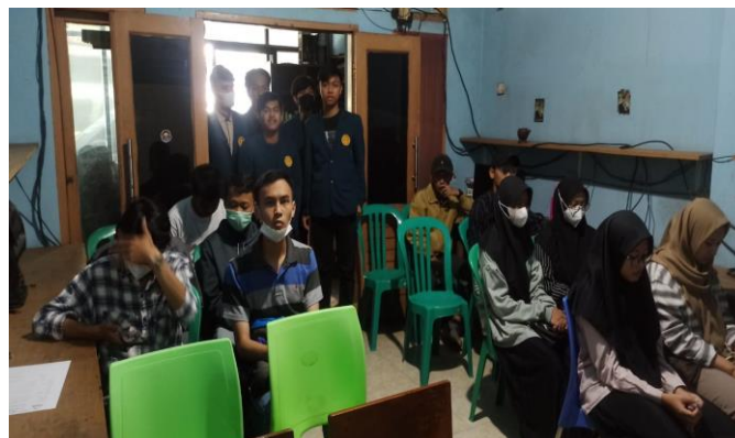
Gambar 4. Kegiatan Pertemuan 1 dan 2

Sedangkan lanjutan pembahasan kegiatan secara luring untuk diskusi dengan mitra seperti yang tampil pada gambar 5 berikut ini :