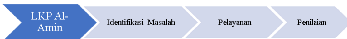
Gambar 1. Tahapan Kegiatan

Bentuk kegiatan sosialisasi dilakukan secara daring dan luring. Dalam pelaksanaan kegiatan tersebut terdiri dari 4 tahap yaitu identifikasi masalah, pelayanan, laporan dan penilaian. Tahapannya sebagaimana tampak pada Gambar 1 berikut.