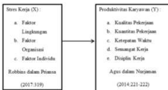
Gambar 3 Kerangka Pemikiran