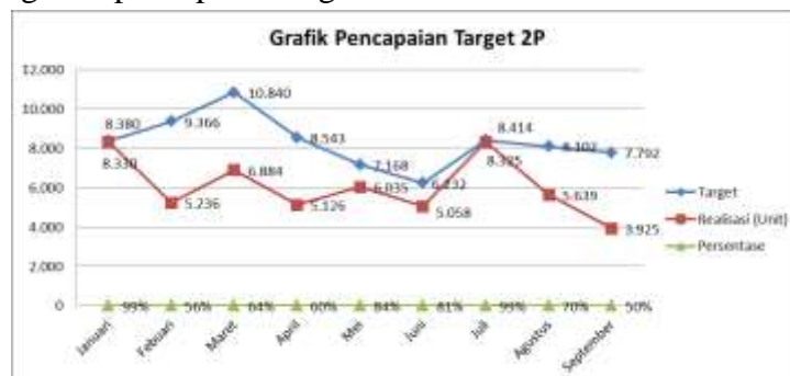
Gambar 2 Pencapaian Target Penjualan 2P

Berikut adalah grafik pencapaian target 2P: