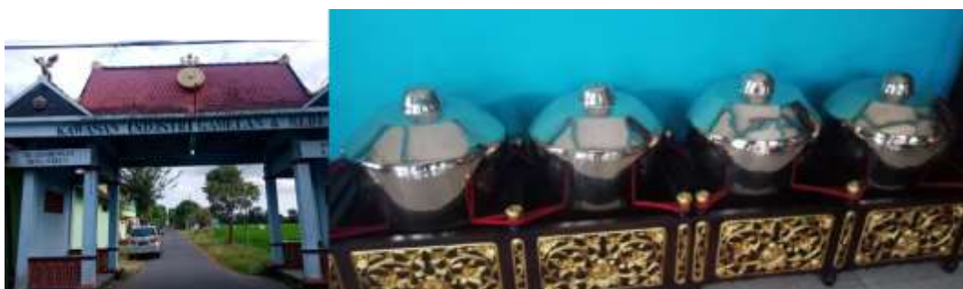
Gambar 1. Gamelan yang diproduksi perajin di desa Wirun, Mojolaban, Sukoharjo sampai sekarang masih bertahan dengan menggunakan teknologi tradisional.

Beberapa komponen dan syarat syarat tersebut pada tabel diatas tersebut menurut Yoeti , (1996) terdapatnya 3 komponen tersebut merupakan syarat utama , dan yang lain lainnya dapat dikembangkan sesuai potensi yang dimiliki oleh daerah tersebut. Pemerintah Kabupaten Sukoharjo menyadari bahwa upaya pengembangan desa wisata di desa Wirun tidak dapat dilakukan oleh pemerintah saja tetapi perlu dukungan para pihak pihak terkait termasuk bagaimana peranan Lembaga ekonomi desa yang mampu untuk mengelola dan mengembangkan usaha usaha tersebut secara berkelanjutan menuju Desa Wisata mandiri.