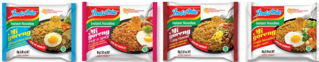
Gambar 3. Varian kemasan Indomie Sumber : www.indomie.com , 2022.

Tujuan sebuah identitas yang kuat pun sangat penting, karena dapat meningkatkan citra merek, membantu merek berkomunikasi lebih efektif dengan pelanggan, memberikan keunggulan kompetitif bagi merek, dan secara langsung dapat diidentifikasi dengan merk (Landa, 2011). Aplikasi dari identitas visual yang konsisten perlu dilakukan secara koheren pada lintas medium agar dapat membantu membangun citra positif pada audiens (Hananto, 2019). Konsistensi dalam penerapan merupakan suatu aspek desain identitas yang krusial, karena kemampuan publik dalam mengidentifikasi dan mengelompokkan media-media yang berbeda berpusat pada kekonsistensian desain merk pada tiap media (Shimp, 2008).