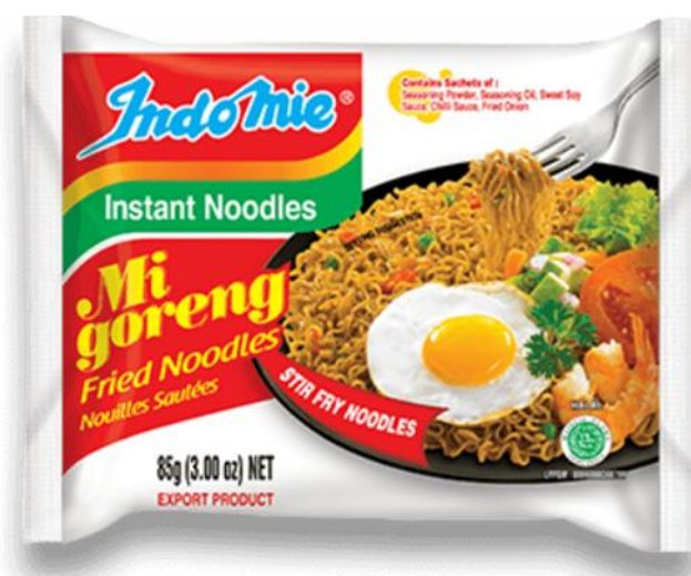
Gambar 2. Kemasan Indomie Mi goreng