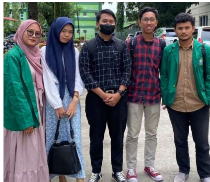
Gambar 3. Dokumentasi pengajaran