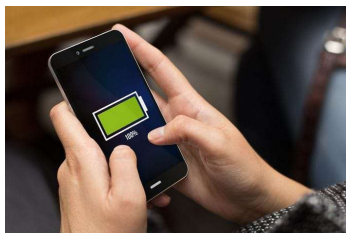
Gambar 2. Handphone

Peralatan yang dibutuhkan berupa handphone dan juga akses internet yang baik, kemudian tim melakukan pengecekan pada hp android yang akan digunakan apakah baterai, kapasitas memori, dan sinyal akses internetnya cukup baik dalam melakukan kegiatan ini, (Japarianto et al., 2020)