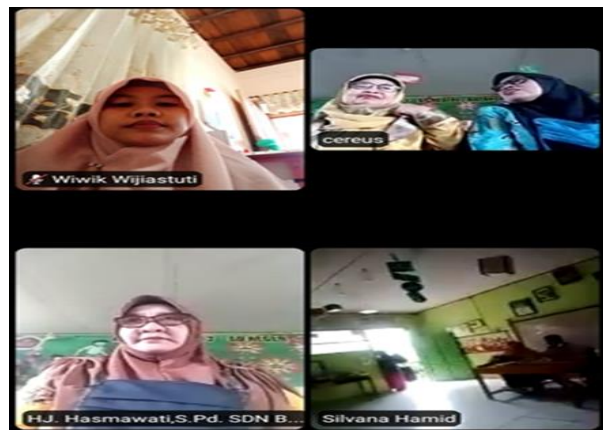
Gambar 2. Penyampaian Tujuan Pelaksanaan Kegiatan Pengabdian pada