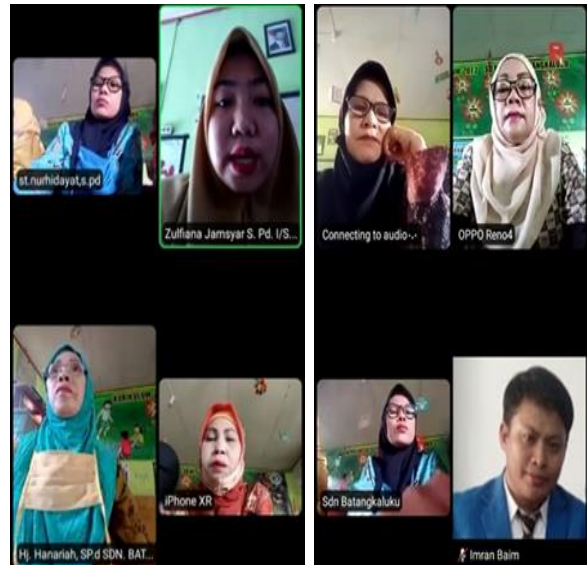
Gambar 7. Antusiasme Guru-Guru dalam Kegiatan Pelatihan

guru-guru yang mengajukan pertanyaan terkait judul pelatihan.