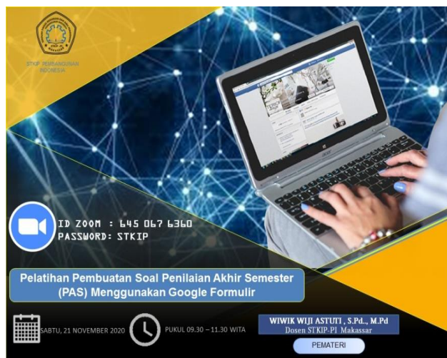
Gambar 1. Poster Digital Kegiatan Pelatihan Pembuatan Soal Menggunakan Google Formulir