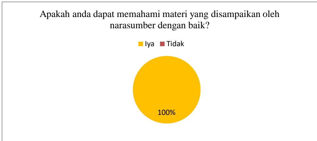
Gambar 2. Hasil Instrumen Kepuasan Peserta Pertanyaan No 2