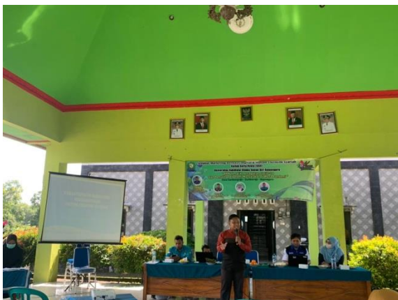
Kegiatan Penyuluhan kepada Ibu-ibu PKK dan Karang Taruna Desa Sambongrejo