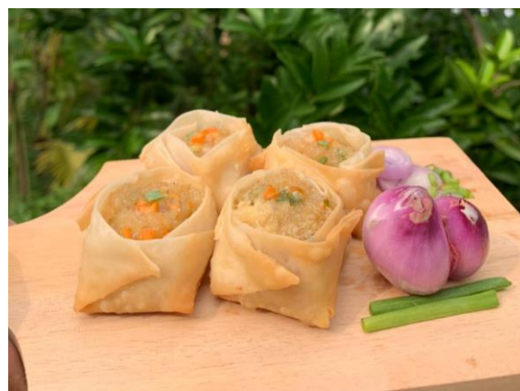
Salah satu makanan olahan berbahan dasar tahu