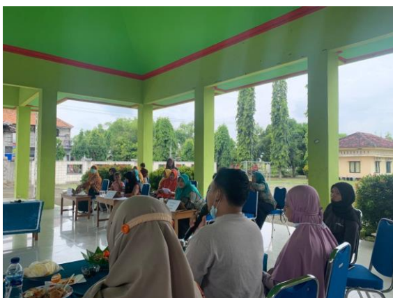
Lomba Memasak Berbahan Dasar Tahu oleh Ibu-Ibu PKK Desa