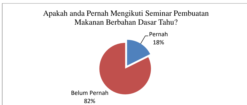
Gambar 1. Hasil Instrumen Kepuasan Peserta Pertanyaan No 1

Usai pelaksanaan kegiatan, instrumen angket kepuasan dibagikan kepada peserta untuk menilai tingkat keberhasilan dari agenda tersebut. Hasil instrumen kepuasan oleh peserta ditunjukkan oleh diagram-diagram pada Gambar 1-4. Berdasarkan hasil responden yang telah diisi oleh peserta, dapat disimpulkan bahwa masyarakat senang dan antusias dengan adanya kegiatan ini. Peserta juga merasa bahwa kegiatan ini bermanfaat dan menambah pengetahuan terkait pengembangan makanan berbahan dasar tahu. Sehingga tentunya menjadi peluang baru dan bentuk pengembangan dari UMKM yang ada di Desa Sambongrejo.