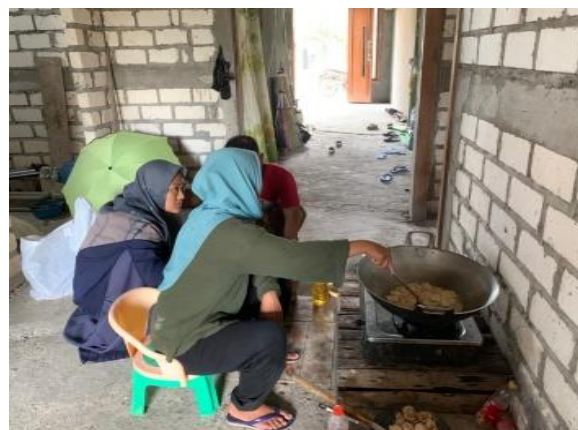
Proses Pembuatan Keripik Tahu