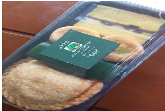
Gambar 3. Produk kue yang telah dipasang stiker