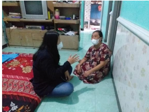
Gambar 1. Kunjungan ke rumah pemilik UMKM Kue Lemper

Selain itu, belum adanya brand yang melekat pada UMKM membuat produk belum dikenal secara luas oleh masyarakat. Kurangnya pemahaman mengenai pentingnya brand bagi sebuah produk menjadi alasan belum adanya brand untuk kue lempur ini. Branding sendiri merupakan hal penting yang dapat menarik konsumen (Nasrullah, 2015). Distribusi kue lempur biasanya dilakukan dengan menitipkan ke beberapa pasar dan penjual kue eceran seperti Pasar Kepatihan, Pasar Bungur, Etalase penjual di Semeru, Kebonsari, dan Jalan Kalimantan. Dengan diberikannya branding pada kue lempur, UMKM diharapkan dapat dikenal lebih luas oleh masyarakat sehingga dapat mengoptimalkan pendapatan. Hal-hal diatas merupakan permasalahan yang dialami UMKM akibat dampak dari adanya pandemi covid-19. Maka dari itu, dalam program pengabdian kepada masyarakat ini berencana untuk mengoptimalkan pendapatan UMKM melalui pemanfaatan media digital dan juga memberikan branding agar produk kue lempur dapat dikenal luas oleh masyarakat.