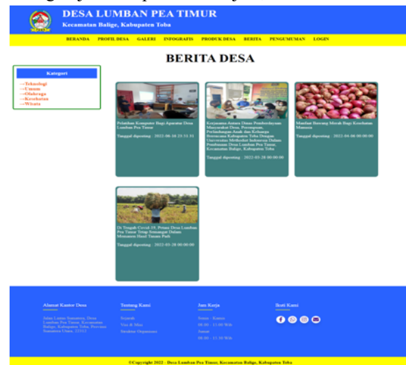
Gambar 10. Halaman Berita Desa

Halaman berita desa merupakan yang berfungsi untuk menyampaikan informasi tentang peristiwa yang sedang terjadi maupun telah terjadi,