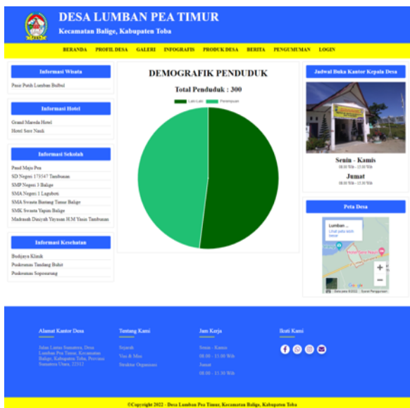
Gambar 8. Halaman Demografi Penduduk

Pada halaman ini menampilkan informasi tentang infografis penduduk Desa Lumban Pea Timur dengan menyajikan dalam tampilan sebuah grafik dimana tampilan tersebut bertujuan untuk menampilkan informasi yang kompleks, singkat dan jelas.