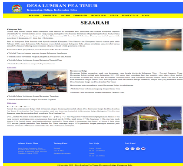
Gambar 6. Halaman Profil Desa

Halaman profil desa ini berfungsi untuk menampilkan gambaran tentang Desa Lumban Pea Timur.