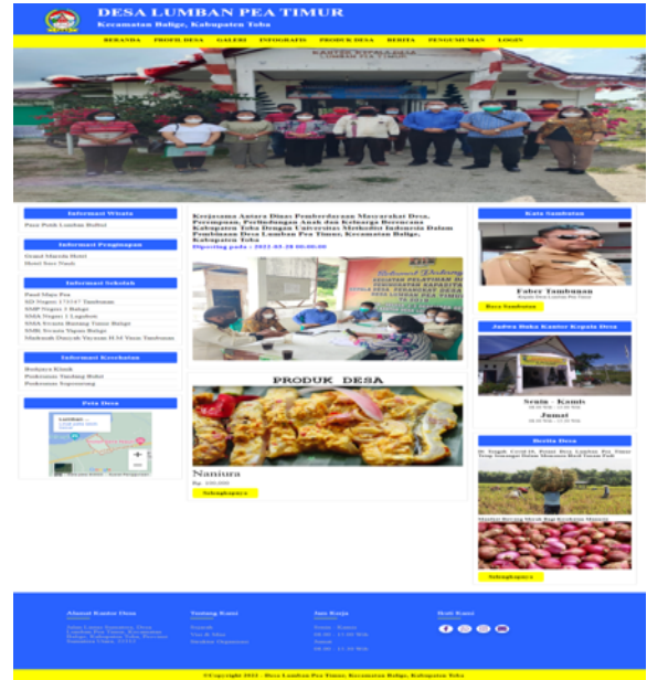
Gambar 5. Halaman Beranda

Tampilan halaman beranda merupakan tampilan menu utama sebuah website yang berfungsi menampilkan seluruh informasi kepada pengunjung website .