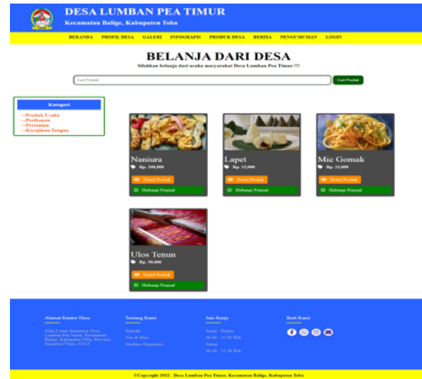
Gambar 9. Halaman Produk Desa

Halaman ini berfungsi sebagai wadah untuk membantu memasarkan hasil umkm masyarakat desa. Pada halaman ini menampilkan produk-produk yang dimiliki masyarakat desa dimana hal tersebut dapat memberi kesempatan bagi usaha mereka dan meningkatkan penjualan mereka.