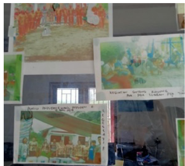
Gambar 2. Foto Galeri Desa Lumban Pea Timur di Papan Pengumuman