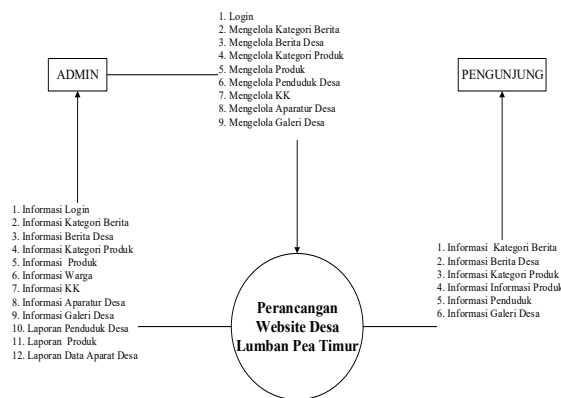
Gambar 3. DFD Level 0 Perancangan Website Desa Lumban Pea Timur

Setelah mengetahui alur sistem yang ada, maka diperlukan sebuah website desa yang dapat membantu pemerintahan Desa Lumban Pea Timur dalam menyampaikan informasi kepada masyarakat desa. Dalam merancang sebuah website desa diperlukan sebuah perancangan yang baik. Adapun Diagram Level 0 atau sering disebut Diagram Konteks pada website Desa Lumban Pea Timur merupakan tahap awal yang penulis lakukan dalam merancang sebuah website desa, kemudian akan diuraikan lebih detail kedalam Diagram Level 1. Gambaran dari Diagram Level 0 dan Diagram Level 1 akan digambarkan pada gambar 3 dan 4 sebagai berikut: