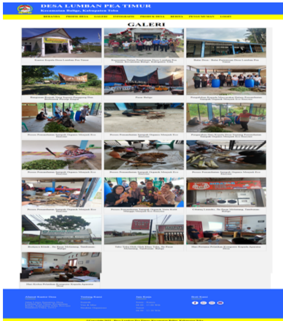
Gambar 7. Halaman Galeri Desa

Halaman galeri desa ini berfungsi sebagai wadah untuk menampilkan hasil tangkapan gambar dari kegiatan atau aktivitas pada pemerintahan Desa Lumban Pea Timur.