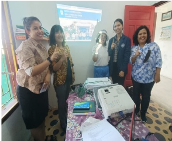
Gambar 11. Foto Bersama Dengan Aparatur Desa Lumban Pea Timur Setelah Pengujian Website Desa.

evaluasi kepada aparaturnya Desa Lumban Pea Timur yang selanjutnya akan menjadi pengelola website desa.