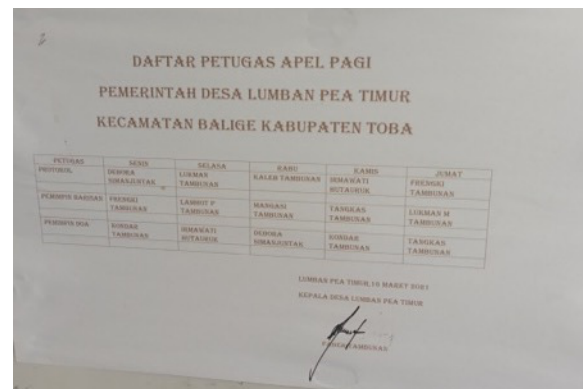
Gambar 1. Foto Informasi Desa Lumban Pea Timur di Papan Pengumuman

Pengumpulan data penduduk ialah keseluruhan dari pencatatan total data demografis di suatu desa. Pada Desa Lumban Pea Timur proses pengumpulan data penduduk masih dilakukan secara manualisasi yaitu dengan memanfaatkan Microsoft Excel sebagai basis datanya. Selain itu penyampaian informasi pada Desa Lumban Pea Timur masih dilakukan secara lisan. Masyarakat Desa Lumban Pea Timur memperoleh Informasi seputar desa biasanya berupa komunikasi dari mulut kemulut ataupun memperoleh dari papan pengumuman yang ada di dinding Kantor Desa Lumban Pea Timur sehingga hal tersebut kurang efisien.