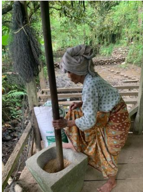
Gambar 2. Penumbukan Hasil Panen Menggunakan Lesung