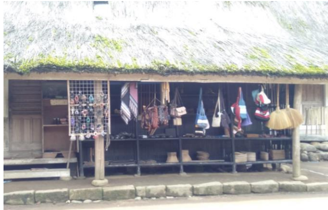
Gambar 3. Kerajinan Masyarakat Kampung Naga Yang Diperjualbelikan