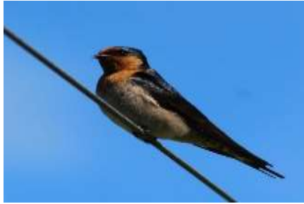
Gambar 3. Burung Layang-Layang Batu ( Hirundo tahitica )

Burung ini memiliki warna biru pada bagian tubuh bagian atas dengan dahi berwarna merah. Tenggorokan berwarna merah juga dan tidak ada garis biru pada bagian dada atas sedangkan bagian perut bawah berwarna putih. Memiliki ukuran kecil dan lebih pendek dari pada burung layang-layang Api ( Hirundo rustica ).