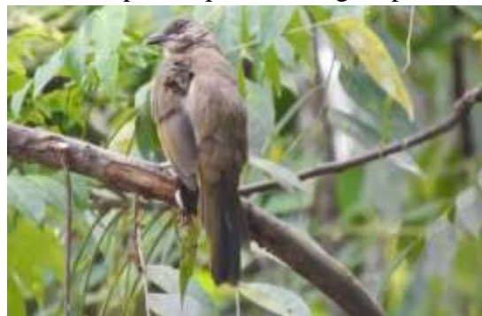
Gambar 6. Burung Merbah Belukar ( Pycnonotus plumosus )

Burung ini memiliki ukuran tubuh sedang berkisar 17 cm dengan ciri khas iris mata yang berwarna merah dan hampir seluruh tubuhnya berwarna coklat. Pada bagian perut bawah berwarna coklat keputih - putihan. Bagian perut serta kaki berwarna merah