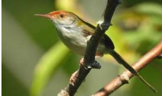
Gambar 11. Burung Cinenen Pisang ( Orthotomus sutorius )

Burung ini memiliki ukuran lebih kurang sekitar 10 cm. Dahi dan mahkota berwarna merah kerat, sisi kepala berwarna putih, tekuk berwarna abu-abu. Bagian punggung, ekor dan sayap berwarna hijau zaitun, iris mata kuning tua pucat, paruh bawah berwarna merah jambu, paruh bagian atas berwarna kehitaman, kaki merah jambu. Pakan utama berupa serangga.