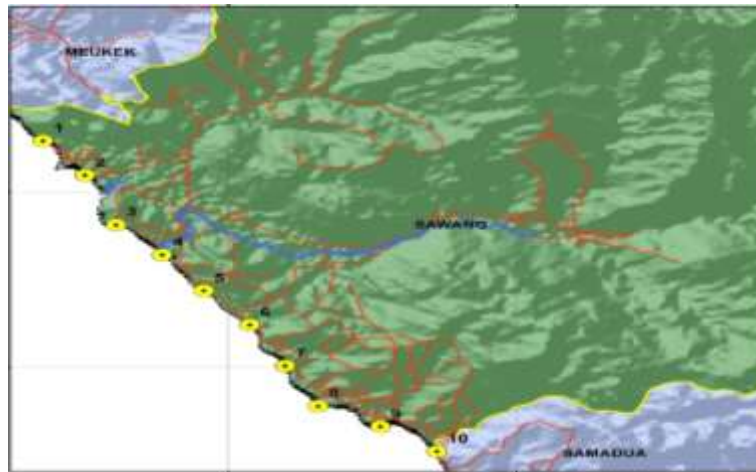
Gambar 1. Sketsa Lokasi Titik Hitung