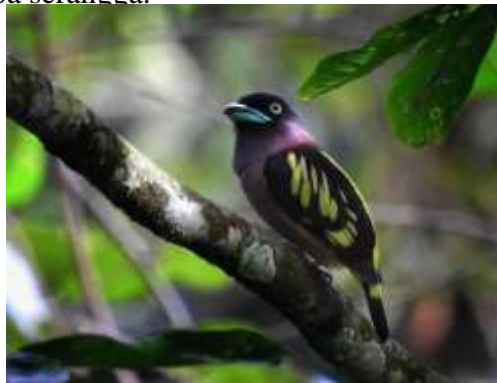
Gambar 14. Burung Sempur Hujan Darat ( Eurylaimus ochromalus )b.

Burung memiliki tubuh kecil sekitar 15cm dengan paruh yang besar berwarna biru. Bagian kepala berwarna hitam yang khas, leher berwarna putih dan terdapat pita hitam melintang pada dada atas. Bagian tunggил kuning dan perut bagian bawah berwarna merah muda. Sayap burik dan ada bintik pada terminal ekor. Pakan utama berupa serangga.