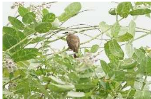
Gambar 5. Burung Merbah Cerucuk ( Pycnonotus goiavier )