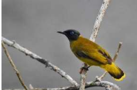
Gambar 8. Burung Cucak Kuning ( Pycnonotus Melanicterus )

Burung ini memiliki ukuran tubuh sedang. Pada bagian atas (kepala, jambul, Tenggorokan dan leher) berwarna hitam. Sayap berwarna kuning kehijauan, serta bagian kaki berwarna hitam. Bagian ekornya berbentuk panjang yang dipariasi oleh warna kuning kehijauan dan hitam.