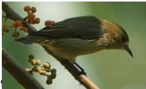
Gambar 9. Burung Cabai Polos ( Dicaeum concolor )

Burung ini memiliki ukuran tubuh kecil dan berwarna buram, bagian tubuh atas berwarna hijau zaitun sedangkan bagian tubuh bawah berwarna pucat. Bentuk paruh panjang, runcing dan berwarna gelap.