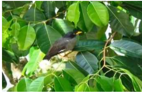
Gambar 13. Burung Jalak Kerbau ( Acridhothers javanicus )