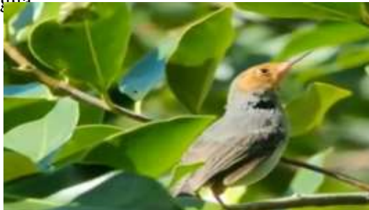
Gambar 12. Burung Cinenen Kelabu ( Orthotomus ruficeps )

Burung ini memiliki ukuran tubuh terkisar lebih kurang 10-12 cm, bulu dasar coklat kemerahan, bagian bawah ditutupi bulu berwarna abu-abu kecoklatan, pada bagian punggung berwarna abu-abu, kaki langsing dan paruh berwarna merah. pakan utamanya berupa serangga.