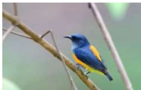
Gambar 10. Burung Cabai Bunga Api ( Dicaeum trigonostigma )

Burung ini memiliki ukuran tubuh yang kecil dan terdapat perbedaan warna bulu antara burung jantan dengan burung betina.