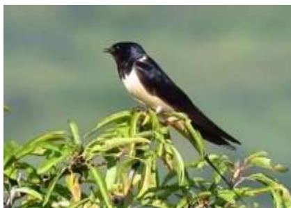
Gambar 2. Burung Layang-Layang Api ( Hirundo rustica )

Tubuh berukurannya sekitar 20 cm dengan bagian atas berwarna biru baja, bagian perut hingga tenggorokan berwarna putih, dan mempunyai bulu ekor yang panjang.