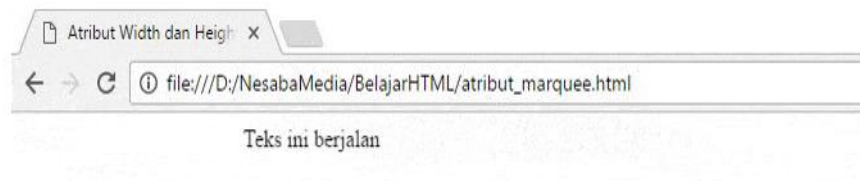
Gambar 1: Tampilan WEB Marquee Tulisan Berjalan

<html> <html> <head> <title>Atribut Width dan Height di Tag Marquee</title> </head> <body> <marquee width="500" height="40">Teks ini berjalan</marquee> </body> </html>