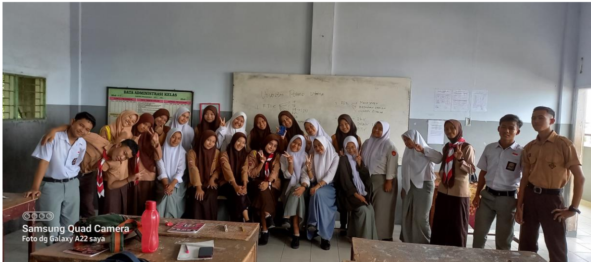
Gambar 2. Kegiatan Foto Bersama dengan Peserta Abdimas

Berdasarkan wawancara, tanya jawab dan pengamatan langsung selama kegiatan berlangsung, kegiatan pengabdian pada masyarakat ini memberikan hasil sebagai berikut: