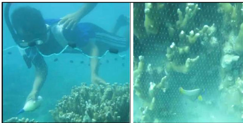
Figure 5. Teknik Menangkap Ikan Injil dengan Konsentrasi Minyak Cengkeh

Memberikan pendampingan dengan memberikan pelatihan tentang cara standarisasi perawatan produk untuk memastikan bahwa sistem dan prosedur karantina ikan hias sudah benar. Produksi ikan hias bisa berjalan dengan baik, dan selalu lebih baik. Untuk keterampilan sumber daya manusia, UKM telah mengikuti program bimtek atau pelatihan terakreditasi yang dilakukan oleh industri dan instansi terkait.