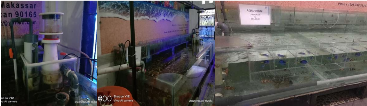
Figure 1. Farm UKM Rezky Bahari dan Produksi Ikan Hias Laut

Khalayak Sasaran: Sasaran adalah ke dua UKM sebagai koordinator penangkap ikan hias dan kordinator untuk ekspor. Kegiatan yang dilakukan oleh tim terdiri dari beberapa tahapan sebagai berikut: