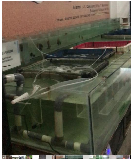
Figure 6. Diagram alir aklimatisasi atau karantina

mengandung ikan lama. Untuk melihat detail kegiatan masing-masing tahapan di atas dapat ditemukan pada Standard Operating Procedure Conditioning (POS) dan Adjustment Figure 4.