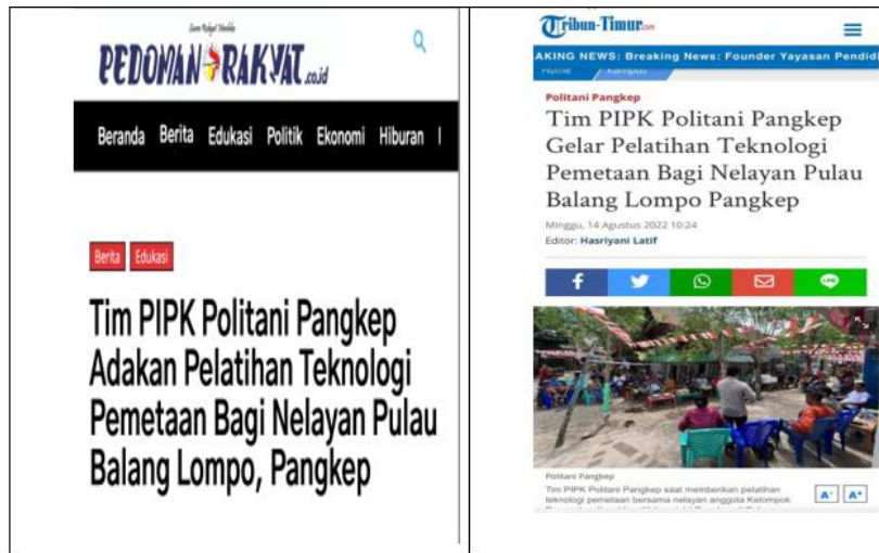
Figure 2. Berita pelatihan untuk kedua mitra PIPK di Media Online

Penerapan IPTEK Pengembangan Kewilayahan (PIPK); Peningkatan Kualitas Produksi Ikan Hias Karang dengan Konsentrasi Minyak Cengkeh Alternatif Alat Tangkap Lestari. Produksi agribisnis ikan hias dari hasil tangkapan merupakan awal peningkatan kualitas. Selanjutnya sarana dan prasarana seperti Sistem resirkulasi tertutup skala industri merupakan alternatif tempat pemeliharaan ikan hias dan karang hias.