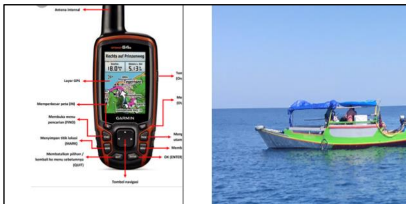
Figure 3. GPS Garmin dan Kapal Nelayan di Lokasi Tangkap

Pendampingan ini memberikan pemahaman tentang legalitas ketika datang untuk menangkap ikan injel hias. Izin menangkap ikan hias diperoleh dari Kementerian Kelautan dan Perikanan (KKP) melalui oss.