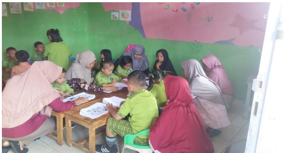
Gambar 4. Tahap ujicoba small group

Untuk menguji kepraktisan, selanjutnya media komik di ujitobakan pada 6 orang anak didik kelas B PAUD mutiara hati yang mempunyai kemampuan yang berbeda-beda dan anak didik didampingi oleh orang tua masing masing. Pada tahap ini dilakukan selama dua hari yaitu tanggal 13-14 Desember 2021. Berdasarkan pengamatan pada saat pembelajaran berlangsung dan hasil respon anak didik menunjukkan bahwa komik terintegrasi nilai Islam dapat digunakan dengan baik oleh anak didik. Proses ujicoba berjalan dengan lancar dimana keenam orang anak didik dapat mengikuti pembelajaran dan mengerjakan soal pada komik dengan baik.