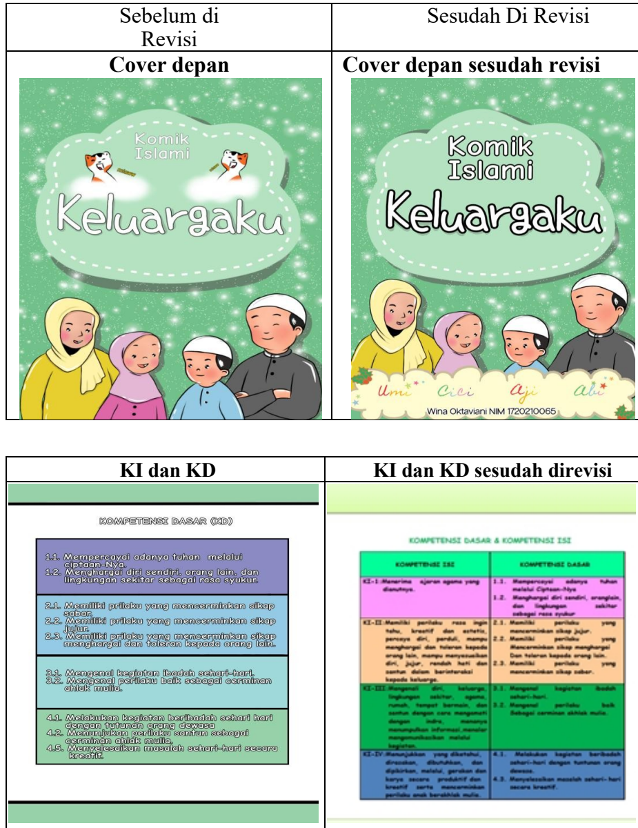
Gambar 2. Revisi Prototipe 1