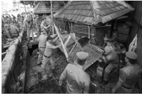
Gambar 1. Penertiban yang dilakukan oleh Satpol PP

Masalah keberadaan pedagang kaki lima terutama di kota-kota besar menjadi warna tersendiri serta menjadikan pekerjaan rumah bagi pemerintah kota. Pedagang kaki lima atau PKL adalah merupakan pihak yang paling merasakan dampak dari berbagai kebijakan yang dikeluarkan oleh pemerintah terutama kebijakan tentang ketertiban dan keindahan kota. Dampak yang paling signifikan yang dirasakan oleh PKL adalah seringnya PKL menjadi korban pengusuran Satpol PP serta banyaknya kerugian yang dialami oleh PKL tersebut, baik kerugian materil maupun kerugian non materil.