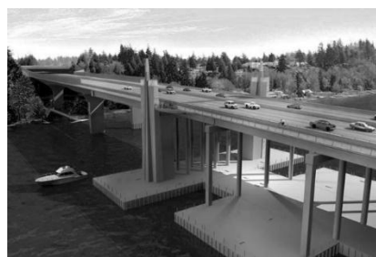
Gambar 3. Pondasi pontoon yang sudah dijadikan dasar untuk pemasangan tiang beton untuk jembatan layang