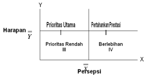
Gambar 1. Substanstial gambar diagram kartesius