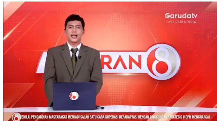
Gambar 4. Penayangan di TV Garuda