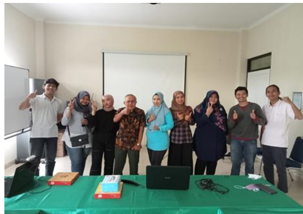
Gambar 5. Dosen dan mahasiswa panitia PKM Online