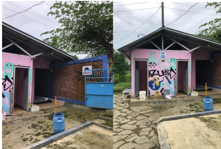
Gambar 4. Fasilitas Umum Toilet dan Mushola Taman Lazuardi 2022