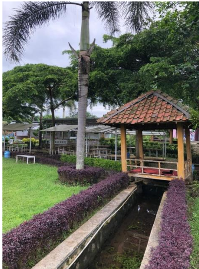
Gambar 2. Taman Edukasi di Taman Lazuardi 2022