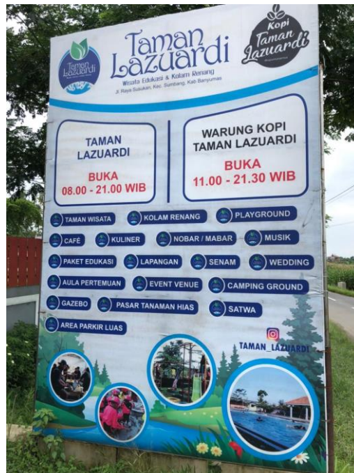
Gambar 6. Spanduk Depan Taman Lazuardi 2022