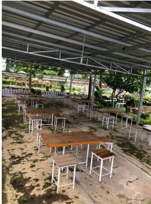
Gambar 7. Cafe Taman Lazuardi 2022

Pengembangan yang terkesan lambat seperti ini, tentu menjadi salah satu permasalahan yang menjadi satu titik perhatian dan menjadi tolak ukur keberhasilan BUMDes (Hallvard Moe. 2010). Hal ini dikarenakan perkembangan zaman yang semakin pesat membuat pengelolaan BUMDes semakin terus berkembang. Pergerakan pengembangan yang terbilang minim membuat BUMDes semakin tertinggal dan sulit bersaing dengan kompetitor yang lain dalam mencapai suatu tujuan yang secara luas. Dengan hal tersebut, diperlukannya penguatan terhadap manajemen kelembagaan BUMDes dalam menopang pergerakan-pergerakan secara masif untuk menciptakan gagasan ataupun ide inovasi dan kreatif dalam pengembangan pengelolaan BUMDes yang dapat bermanfaat dan berkontribusi bagi masyarakat dan pemerintah desa. Meskipun demikian dalam pengelolaannya, BUMDes Mitra Usaha Makmur terus berupaya menerapkan tata kelola usaha sebaik mungkin namun secara umum belum maksimal dilakukan. Hal ini dibuktikan dari adanya struktur kepengurusan BUMDes Mitra Usaha Makmur yang terdiri dari direktur, tim pelaksana teknis, dan tim administrasi. Kesederhanaan struktur pengurus adalah sebanding dengan kesederhanaan tata kelolanya. Direktur dalam memimpin BUMDes Mitra Usaha Makmur ini membagi segala urusan menjadi dua macam, yakni urusan teknis dan urusan administratif. Urusan teknis meliputi urusan produksi dan urusan pemasaran. Sedangkan urusan administratif adalah meliputi urusan pengelolaan SDM dan keuangan.