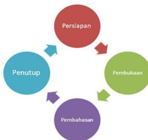
Gambar 1. Prosedur Pelaksanaan