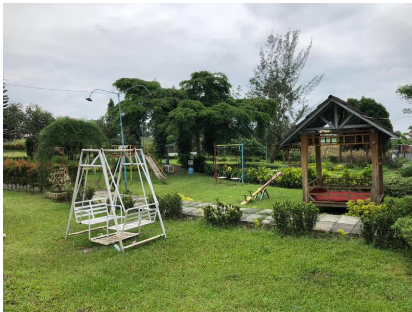
Gambar 3. Taman Edukasi di Taman Lazuardi 2022