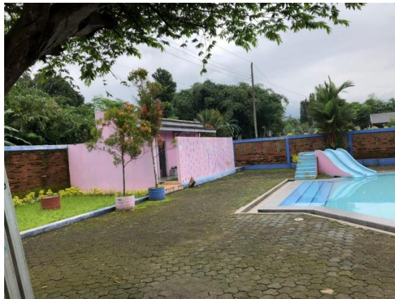
Gambar 5. Kolam Renang dan Ruang Bilas Taman Lazuardi 2022