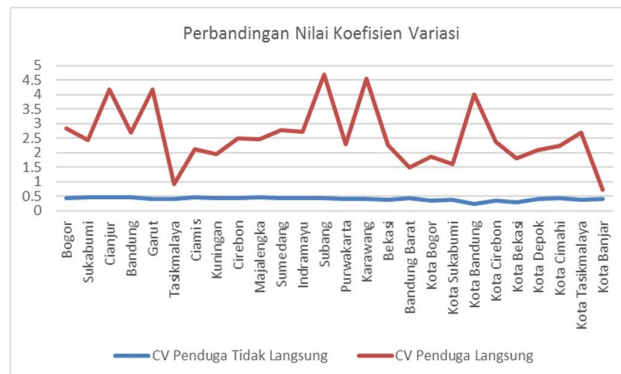
Gambar 2. Perbandingan Nilai Koefisien Variasi

Perbandingan nilai koefisien variasi (CV) dari estimasi langsung dan tidak langsung dapat dilihat dengan diagram berikut: