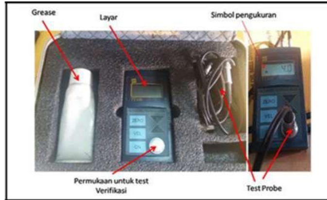
Gambar 1. Ultrasonic Thickness Gauge TT 130

Material Struktur conveyor menggunakan baja ASTM A36 dengan kandungan karbon <0,3%. Berdasarkan kandungan karbon yang dimiliki, maka struktur conveyor ini termasuk kedalam jenis baja low carbon steel. Tebal nominal dan aktual akan digunakan untuk menghitung laju korosi dan juga sisa umur pakai struktur conveyor dengan menggunakan alat ultrasonic thickness gauge TT 130.