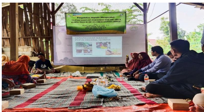
Gambar 3. Penyuluhan pembuatan pupuk dan kompos.