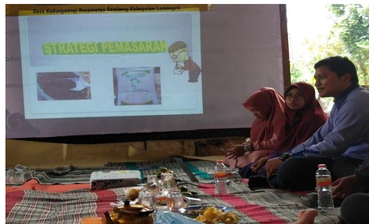
Gambar 5. Penyuluhan pemasaran dan branding produk