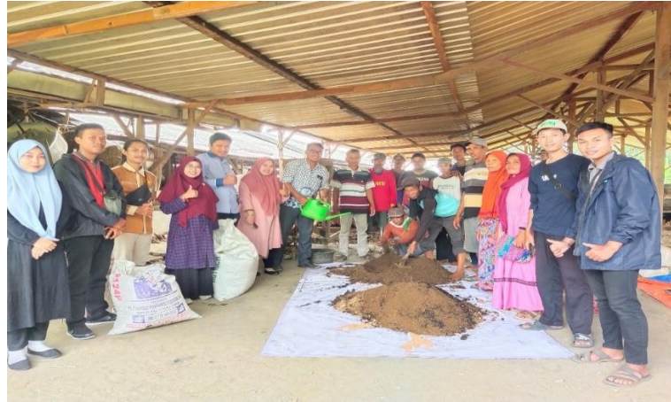
Gambar 4. Pelatihan pembuatan pupuk dan kompos