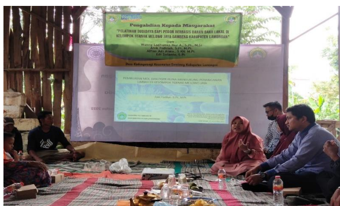
Gambar 2. penyuluhan pembuatan Mol