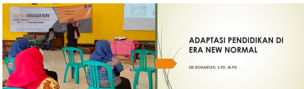
Gambar 1 PKM Tentang Pendidikan