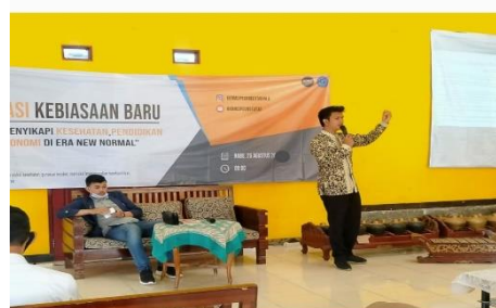
Gambar 2 PKM Tentang Ekonomi