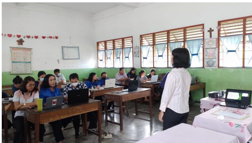
Gambar 5. Peserta Mulai Bekerja

Membuka jendela canva diawali dari browser chrome/mozilla, lalu ketik canva.com dan hasilnya seperti pada gambar 4. Seperti pada tampilan canva diatas, terdapat menu utama dibagian kiri dan atas. Setelah tampil beranda canva, maka canva sudah bisa digunakan untuk berbagai kebutuhan.