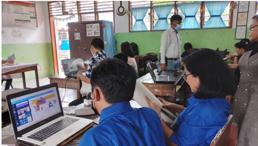
Gambar 6. Antusias Peserta Bekerja