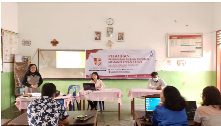
Gambar 1. Tim Membuka Kegiatan Pelatihan

Melihat dari semangat para guru yang mengikuti pelatihan mulai dari awal hingga akhir kegiatan, tim PkM juga semakin semangat untuk menyampaikan materi dan membantu setiap peserta yang mengalami kendala dalam mengoperasikan laptop dan android masing-masing peserta.