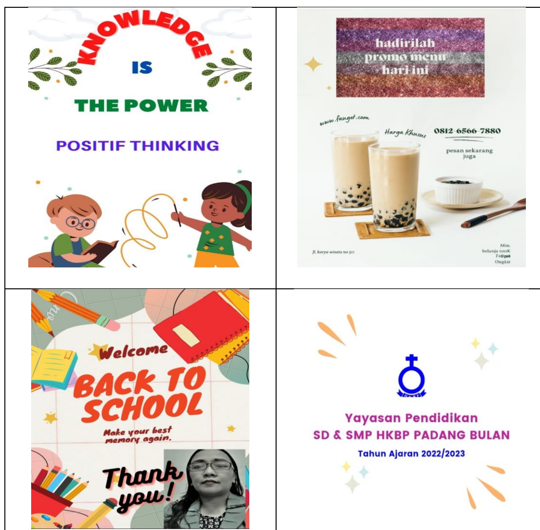
Gambar 10. Desain Poster Beberapa Guru