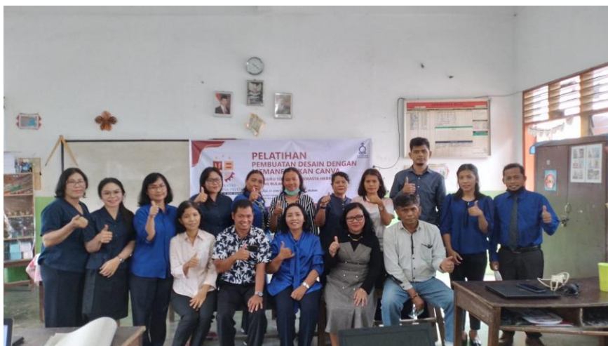
Gambar 8. Tim PKM dan Peserta Pelatihan Selesai Pelatihan

Kegiatan sudah selesai dan dilakukan foto bersama peserta pelatihan.