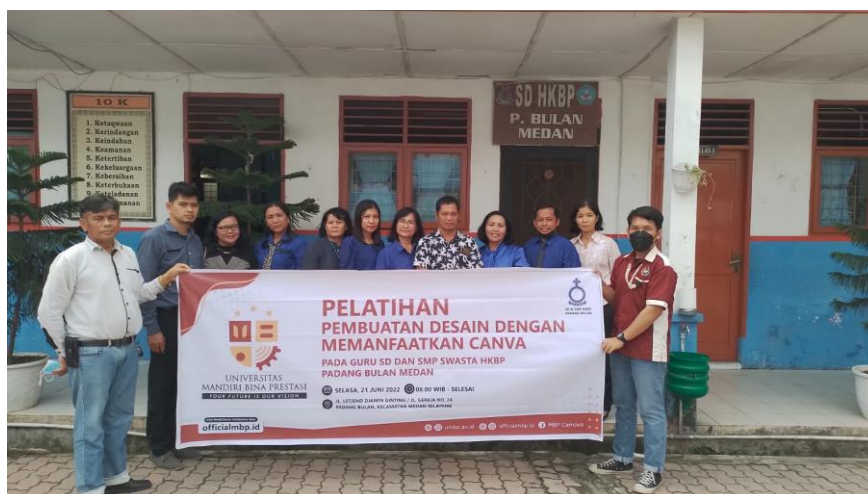
Gambar 9. Peserta dan Tim berfoto di depan kantor SD HKBP

Kegiatan sudah selesai dan dilakukan foto bersama peserta pelatihan.