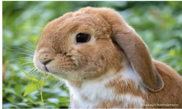
Gambar 2: Kelinci sebagai gagasan awal