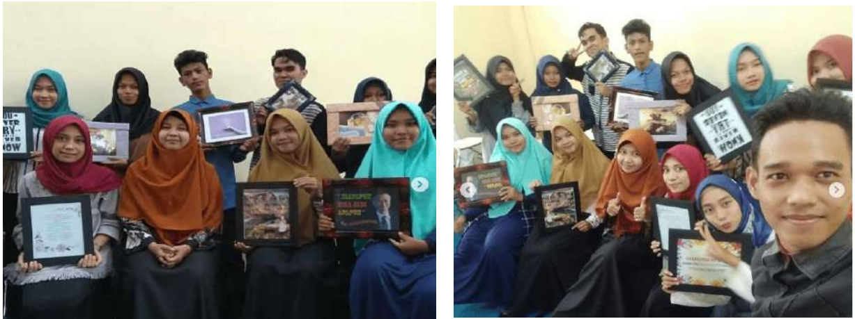
Gambar 2. Foto Bersama Dengan Para Peserta