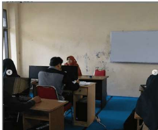
Gambar 1. Perkenalan Dengan Mahasiswa ESSA

Berikut dokumentasi kegiatan Pelatihan dan Proses Perkenalan dengan Himpunan Mahasiswa Program Studi Bahasa Inggris (ESSA) dan Penjelasan Mengenai Desain Grafis