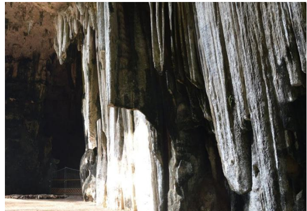
Gambar 2. Gelambir Stalaktit Yang Megah

Tugiman merupakan keturunan ke-3 dari juru kunci yang pertama.