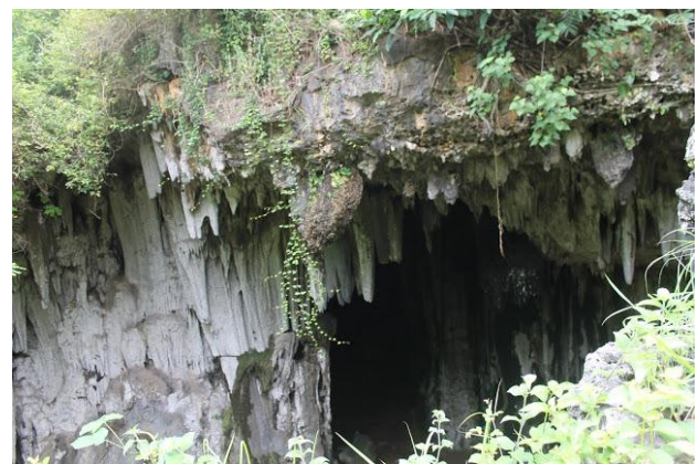
Gambar 6. Mulut Gua Lebar Menganga

yang dibangun oleh tokoh yang bergelar Gusti Kalak. Keunikan lain Goa Kalak memiliki ruangan yang cukup luas. Jika dari depan Gua, memang tampak stalagtit yang sudah mati dan terlihat menghitam, namun di bagian dalam, masih ada stalagtit yang meneteskan air dan tak kalah indah, ada patung togok, soko (batu) guru dan tempat kerajaan brojonoyo yang sudah digempur.