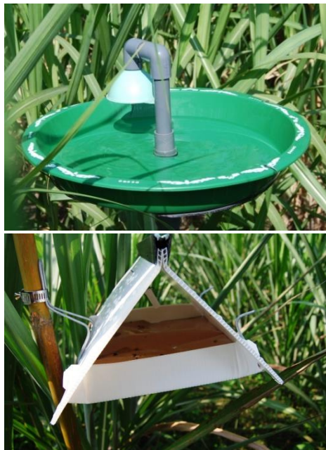
Gambar 1. Perangkap air (atas) dan perangkap segitiga (bawah).

Percobaan dimulai dengan memasang perangkap di dalam kebun dengan jarak \pm 30 m. Sebelum dipasang, water trap diisi air bersih dan beberapa tetes sabun cuci piring, sedang feromon digantung di bagian khusus pada water trap . Adapun untuk delta trap , feromon dipasang menggantung di dalam perangkap (Gambar 1.).