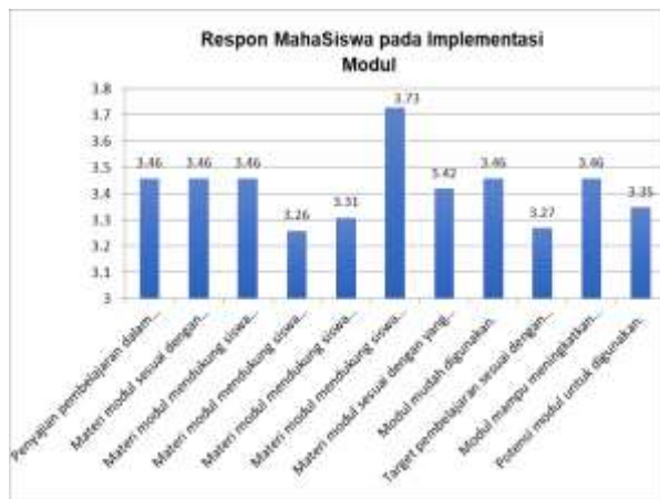
Gambar 1. Grafik Respon Siswa

Kemudian hasil respon siswa dalam beberapa indikator, tersaji pada bentuk grafik berikut ini.