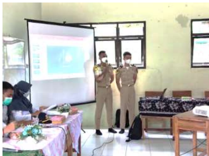
Gambar 4. Taruna PPI Madiun menjelaskan konsep pemanfaatan energi matahari