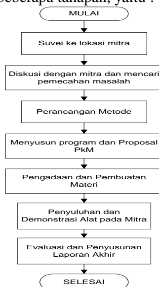
Gambar 1. Prosedur kerja pelaksanaan PKM

Metode Pelaksanaan yang akan digunakan dalam Program Pengabdian Masyarakat ini adalah “Penyuluhan kepada santri Pondok Pesantren Subulul Huda untuk meningkatkan pengetahuan santri terkait energi terbarukan”, karena mengingat pentingnya untuk mengupdate pengetahuan akan teknologi dan pemanfaatannya oleh santri. Sehingga santri tidak hanya memiliki bekal pengetahuan yang baik tidak hanya dalam ilmu agama namun juga dalam perkembangan teknologi saat ini. Khususnya teknologi terkait dengan energi terbarukan. Metode ini memiliki beberapa tahapan, yaitu :