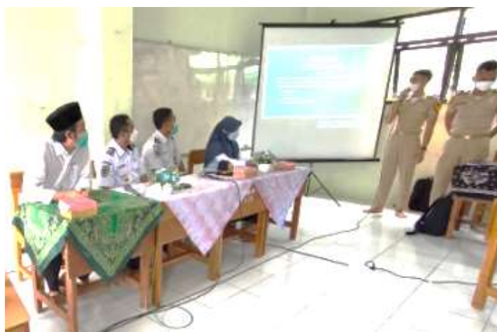
Gambar 1. Penyuluhan dilakukan oleh ketua pelaksanaan kegiatan PKM pada santri pondok pesantren subulul huda

Santri pondok pesanten subulul huda setuju sangat tertarik atas informasi dan manfaat Kegiatan penyuluhan tentang pemanfaatan energi matahari sebagai energi alternatif catudaya peralatan kelistrikan ditunjukkan pada Gambar 1 dan perangkat yang digunakan sebagai penyuluhan dengan komponen berupa photovoltaic, baterai, alat ukur, solar control dan beban lampu sebagai media penyuluhan ditunjukkan pada gambar 2.