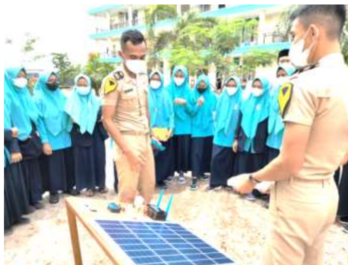
Gambar 3. Taruna PPI Madiun menjelaskan kinerja alat pada santri pondok pesantren subulul huda