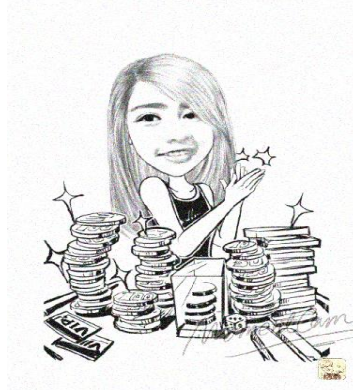
Gambar 6. Gambar Hasil Output