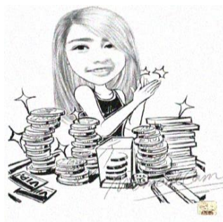
Gambar 1. Citra Karikatur

Filtering adalah suatu proses pengambilan sebagian sinyal dari frekuensi tertentu, dan membuang sinyal pada frekuensi lain. Dalam pengolahan citra, respon perambatan filter memberikan gambaran bagaimana pixel-pixel pada citra diproses. ini Teknik filter ini umumnya bertujuan untuk menghilangkan noise yang terdapat dalam citra dan juga untuk menghaluskan citra. Berikut ini gambar asli piksel dimana gambar tersebut yang akan dianalisa dalam citra yang memiliki noise pada gangguan citra tersebut dengan menerapkan Metode filterMaksimum dan Filter Median .