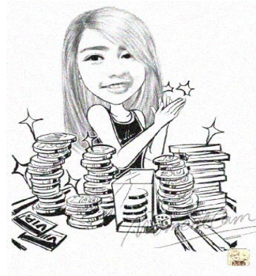
Gambar 5. Gambar Hasil Output