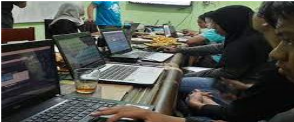
Gambar 4: Peserta pelatihan

Dari proses diatas pemateri memberikan langkah satu persatu dengan menerangkan secara detail proses pembuatan sehingga peserta paham langkah-langkah dengan benar.