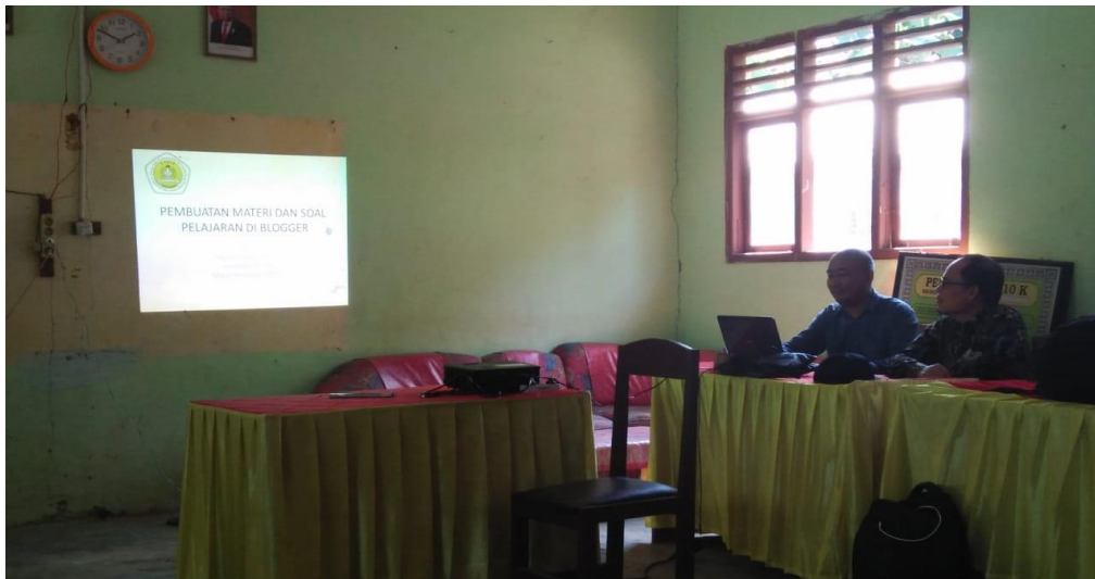
Gambar 1: Pemberian materi oleh narasumber