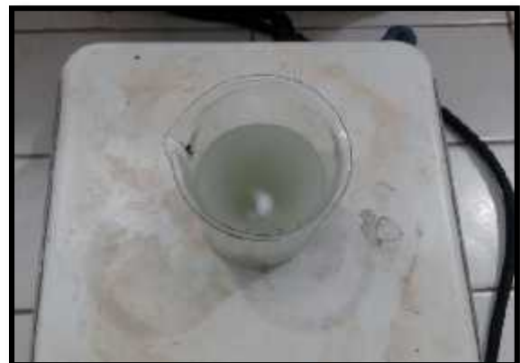
Gambar 2. Proses pengadukan perlakuan air asam dengan zeolit

Zeolit merupakan senyawa dengan kation aktif yang bergerak dan mempunyai kemampuan sebagai penyerap. Keberadaan kristal aluminosilika yang mempunyai struktur berongga atau berporus dan mempunyai sisi aktif yang bermuatan negatif yang mengikat secara lemah kation penyeimbang muatan. Muatan negatif inilah yang menyebabkan zeolit mampu mengikat kation-kation pada air, seperti logam Fe. Sehingga logam Fe yang terkandung dalam air asam akan menempati porus-porus pada zeolit dan konsentrasi logam Fe dalam air asam akan menjadi berkurang.