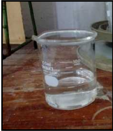
Gambar 3 Perubahan air hasil perlakuan zeolit

Penurunan kadar logam Fe pada air asam dari 1,529 mg/l menjadi 0,147 mg/l dengan perlakuan penambahan zeolit. Dengan adanya perlakuan penambahan zeolit membuat air asam sudah memenuhi nilai standar baku mutu lingkungan yang telah ditentukan keputusan Menteri Kesehatan RI No. 907/Menkes/SK/VII/2002, seperti yang terlihat pada Gambar 3.