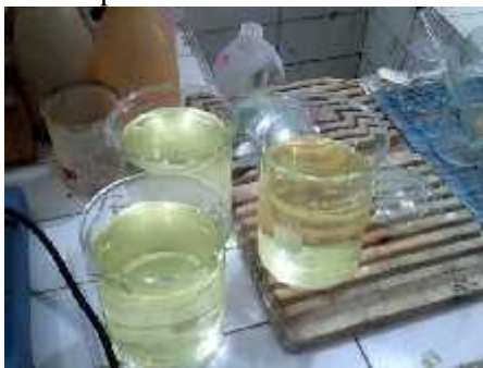
Gambar 1. Keadaan Awal Air Asam dari Stockpile Batubara

Air asam pada stockpile batubara PT. SAG KSO PT. Semen Kupang dihasilkan karena adanya timbunan batubara yang terletak pada area terbuka sehingga terjadi kontak langsung antara mineral pengotor yang terkandung dalam batubara berupa mineral sulfida (pirit dan markasit) dengan udara bebas, yang selanjutnya terjadi pelarutan karena adanya air hujan. Air yang dihasilkan dari stockpile batubara berwarna kuning kecoklatan, keruh dan baunya seperti besi berkarat. Berdasarkan pengujian laboratorium, diketahui bahwa tingkat keasaman (pH) awal air dari stockpile batubara yaitu 5,36 dan kandungan besi (Fe) dalam air tersebut adalah 1,529 mg/l. Bila air tersebut langsung dibuang ke lingkungan maka akan mencemari lingkungan baik air, tanah maupun udara.