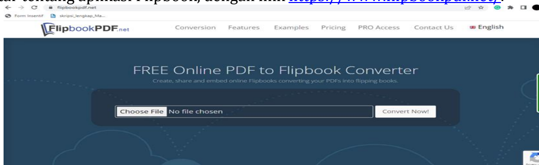
Gambar 1. Halaman Depan Flipbook

Kegiatan workshop dilaksanakan pada tanggal 16 Juli 2022, datang lokasi PKM pukul 08.00, disambut oleh wakil kepala SMP Negeri 7 Sungai Raya, lokasi yang dijadikan tempat PKM adalah SMP Negeri 7 Sungai Raya Kabupaten Kubu Raya. Untuk materi pertama penjelasan mengenai untuk serta perkenalan oleh Tim dosen FKIP oleh bapak Iwan Ramadhan, M.Pd, materi mengenai bahan ajar dan jenis-jenis bahan ajar, salah satunya adalah bahan ajar elektronik yang mudah digunakan, bahan ajar elektronik menggunakan aplikasi gratis yaitu Flipbook, proses penyampaian dilakukan dengan cara pemaparan bahan materi, setiap guru menyiapkan materi yang sederhana dalam bentuk word ataupun pdf, selanjut diberikan pengantar tentang aplikasi Flipbook, dengan link https://www.flipbookpdf.net/ .