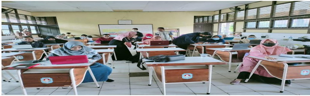
Gambar 3. Praktek dan Pendampingan Kepada Guru-Guru