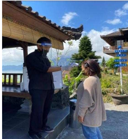
Gambar 1.1 Cek suhu tubuh

Berikut adalah foto-foto yang penulis ambil ketika melakukan wawancara dan observasi di Lakeview Restaurant, yaitu: