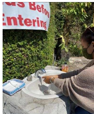
Gambar 2 Cuci tangan

Di masa pandemi ini, pengunjung wajib mengecek suhu tubuh dan menggunakan masker sebelum memasuki restaurant. Jika suhu tubuh melebihi 37,3^{\circ}\text{C} maka tidak diijinkan memasuki restaurant.