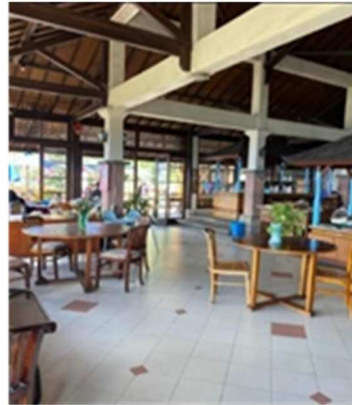
Gambar 4 Lakeview Restaurant Indoor

Pengunjung diwajibkan untuk menggunakan hand sanitizer sebagai antiseptik atau disinfektan yang gunanya untuk membunuh virus dan bakteri.