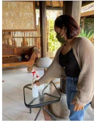
Gambar 3 Hand Sanitizer

Pengunjung diwajibkan untuk menggunakan hand sanitizer sebagai antiseptik atau disinfektan yang gunanya untuk membunuh virus dan bakteri.