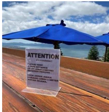
Gambar 6 Attention Sign

Lakeview Restaurant Outdoor memberikan suasana pemandangan gunung dan danau bagi pengunjung sambil menikmati hidangan. Di masa pandemi ini seluruh staf sangat memperhatikan kebersihan dan kepuasan pelanggan dengan mematuhi protokol kesehatan saat menghadirkan makanan. Terlihat pada gambar 1.5 waitress menghadirkan makanan dengan menggunakan hand gloves, memakai masker dan face shield. Selain itu jarak meja satu dengan lainnya yaitu 1 meter.