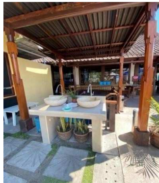
Gambar 7 Washbasin

Setiap meja ada attention sign bagi pengunjung untuk tetap menjaga jarak kurang lebih 2 meter antar sesama. Hal ini dilakukan untuk memperingati pengunjung tetap mematuhi syarat new normal.