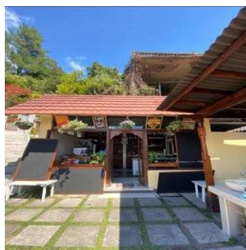
Gambar 8 Lakeview Bar

Di area outdoor restoran disediakan washbasin untuk memudahkan pengunjung mencuci tangan dan selalu memperhatikan kebersihan diri.