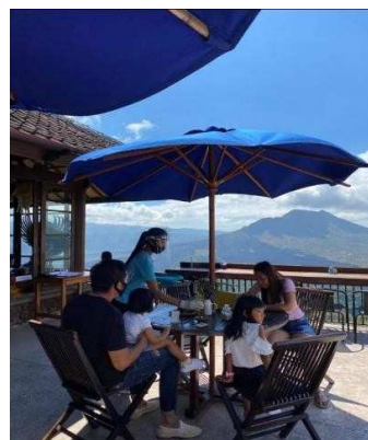
Gambar 5 Lakeview Restaurant Outdoor

Lakeview Restaurant Indoor sebelum pandemi memiliki 100 seats. Namun sejak berlakunya system new normal, pelaku usaha diwajibkan untuk menyediakan fasilitas makan di tempat 50% dari kapasitas normal. Jadi sekarang Lakeview Restaurant Indoor hanya memiliki 50 seats.