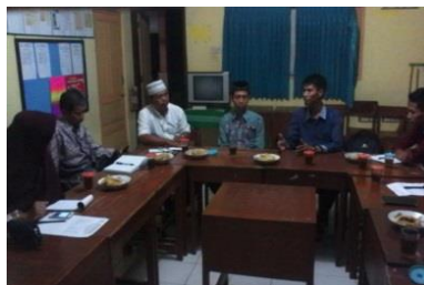
Gambar 4.3 Rapat Koordinasi Ketiga