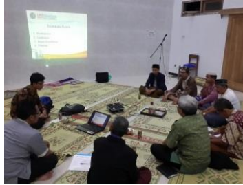
Gambar 4.1 Rapat Koordinasi Pelaksanaan Pertama