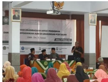
Gambar 4.4 Pelaksanaan Kegiatan Penguatan Kelembagaan