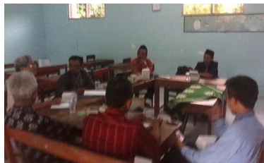
Gambar 4.2 Rapat Koordinasi Pelaksanaan Kedua