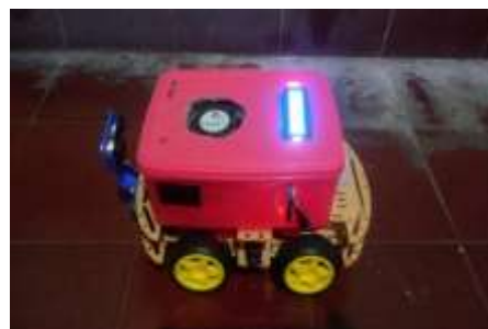
Gambar 4 Hasil Rangkaian Alat Keseluruhan

Pada rangkaian alat diberikan tegangan input langsung sebesar 11,1 V menggunakan 3 buah baterai 3,7 V yang disusun secara seri. Selanjutnya tegangan output yang didapatkan dihubungkan langsung pada PIN 5V board aduino yang juga terhubung dengan VCC pada setiap sensor. Dengan rata-rata beban output pada setiap sensor adalah 4.5V – 5V. Maka tegangan yang diberikan sudah sesuai dengan kebutuhan pada setiap komponen, dan dapat berjalan dengan baik.