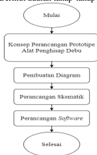
Gambar 1 Tahap Perancangan Alat