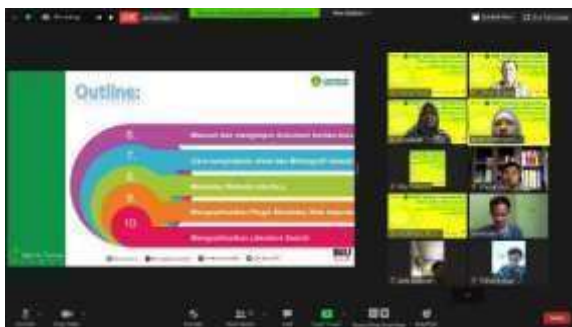
Gambar 1. Materi dalam Pelaksanaan Kegiatan PkM

1) Pengenalan pentingnya mencantumkan sitasi dalam karya ilmiah, 2) Kegunaan software Mendeley , 3) Prosedur pendaftaran akun Mendeley , 4) Cara mendownload dan melakukan install Mendeley Desktop , 5) Cara menggunakan software Mendeley seperti mengenal tampilan antarmuka aplikasi mendeley desktop , menambahkan dokumen kedalam Mendeley , mengatur dokumen dan library , mencari dan mengimpor dokumen dan konten baru, 6) Cara menyisipkan sitasi dari sumber referensi, 7) Cara memasukkan bibliografi otomatis.