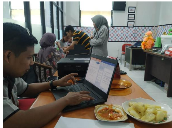
Gambar 1. Sesi Sharing dan Diskusi

sebagai pembuka dari kegiatan pelatihan teater monolog di sekolah ini. Sebuah pepatah menyatakan tidak kenal, maka tidak akan muncul rasa sayang. Melalui pepatah tersebutlah menginisiasi perkenalan dengan bentuk sosialisasi dan sharing session . Pada kegiatan sharing dan diskusi ini dihadiri oleh Tim Pengabdian, guru, dan siswa. Kegiatan pengenalan berlangsung dua sesi. Pada sesi pertama di setting dengan model short time atau pengenalan dalam jangka waktu yang pendek. Secara teknis, pengenalan yang dilakukan dengan perkenalan tim pengabdian dan juga membahas tentang tujuan dari pengabdian yang dilaksanakan di sekolah SMK Telkom Makassar. Dengan terlaksananya kegiatan sesi pertama ini dilakukan, maka pihak sekolah memberikan ruang gerak dan memberi rekomendasi guru dan siswa yang menjadi peserta pelatihan.