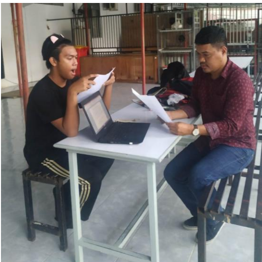
Gambar 2. Mendiskusikan gagasan teater monolog

Pada tahapan ini merupakan tahapan lanjutan setelah melewati tahapan sharing dan diskusi. Kegiatan ini dilakukan agar pemahaman esensial atas monolog teater semakin dipahami secara teoritis dan praktis. Dengan kata lain, pelatihan yang mengupayakan sebuah konsep praksis, sebuah konsep praktik yang didasarkan oleh penerapan teori. Sehingga, pelatihan ini dinilai tidak hanya mengajarkan persoalan praktik tetapi menyeimbangkan pengetahuan teori dan juga kemampuan praktek dalam satu kegiatan pelatihan.