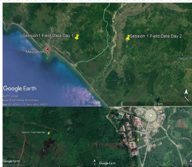
Gambar 3. Lokasi Praktik Lapangan

Pemilihan lokasi dilakukan berdasarkan kemudahan akses dan variasi tutupan lahan untuk melihat adanya perbedaan di kedua lokasi pelatihan lapangan, sehingga hasil yang diperoleh dapat menjadi pertimbangan untuk menetapkan pengelolaan hutan lestari yang spesifik untuk setiap kondisi struktur tegakan. Hutan sekunder merupakan hutan primer yang ditebang untuk memenuhi kebutuhan kayu oleh manusia atau dibuka untuk ladang, atau terbuka karena bencana alami lain, kemudian secara alami terbentuk hutan baru yang belum mencapai klimaks seperti hutan semula (Huby et al. , 2020). Sedangkan hutan kota ialah komunitas vegetasi berupa pohon dan asosiasinya yang tumbuh di lahan kota atau sekitarnya, berbentuk jalur, menyebar, atau bergerombol. Strukturnya menyerupai hutan alam membentuk habitat yang memungkinkan kehidupan bagi satwa liar dan menimbulkan lingkungan sehat dan nyaman (Alvian dan Kurniawan 2010).