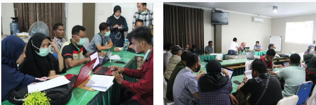
Gambar 2. Diskusi peserta

sebagai daftar periksa, menilai, dan memantau kondisi keanekaragaman hayati di hutan dan sisa-sisa hutan. Alat ini dikembangkan oleh Jaringan Sumber Daya Bernilai Konservasi Tinggi (HCVRN). Lembar data FIA yang dikodekan di Excel mencakup penghitungan dan pelaporan otomatis. Alat ini sangat penting untuk melengkapi alat keanekaragaman hayati pohon, yang lebih cenderung ke arah penilaian ilmiah. Keanekaragaman jenis pohon dapat dijadikan indikator penilaian kesehatan hutan karena sensitive terhadap perubahan. Biodiversitas sangat mudah dipengaruhi oleh lingkungan, inetraksi antar organisme hidup, dan lingkungannya (Safe'I et al. , 2018). Pada alat ini juga disertakan tab pengumpulan data untuk mendokumentasikan sumber daya hutan yang digunakan oleh masyarakat lokal dan rumah tangga.