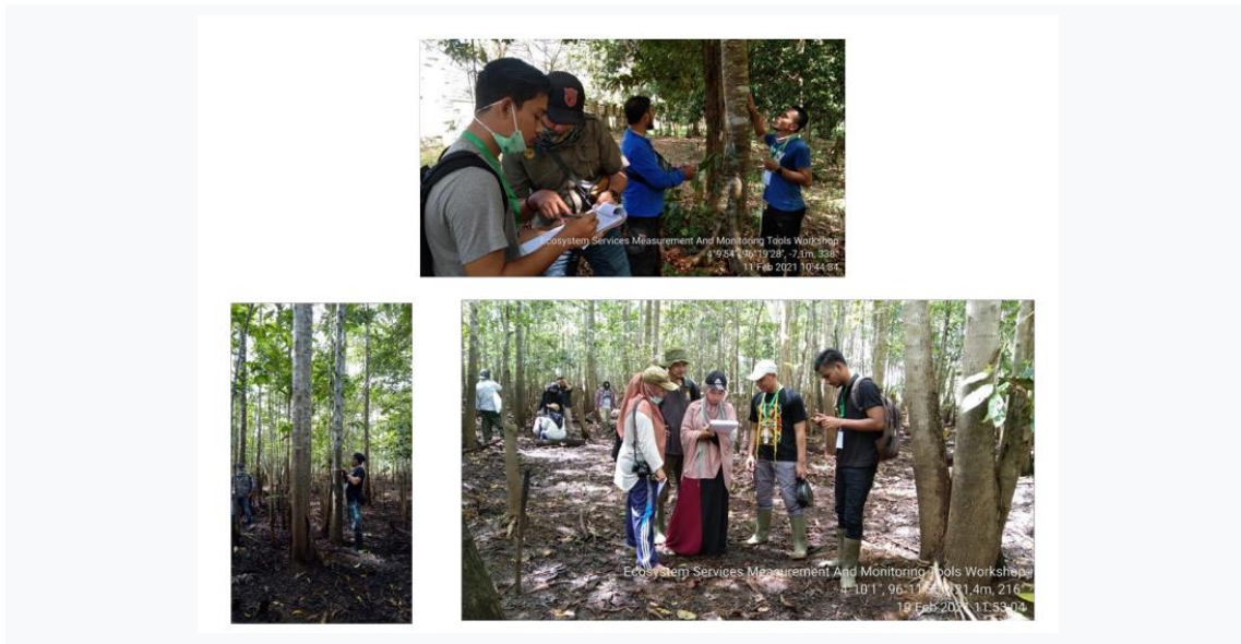
Gambar 4. Praktik Lapangan