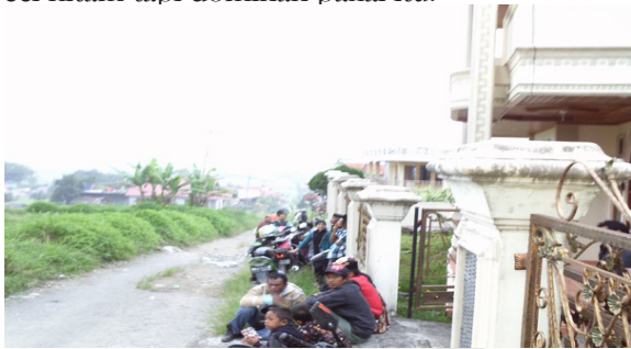
Gambar 3: Para Jama'ah Menunggu

Jama'ah yang datang sebahagian yang masuk namun sebahagian lagi menunggu di tepi jalan sambil berbincang dengan teman atau sejawat mereka. Ciri khas mereka adalah dengan berpeci hitam dan pakai kain yang dililitkan di leher. Peci hitam ini menjadi khas bagi kebanyakan bagi sebahagian jama'ah yang datang. Namun dominan pakai peci hitam adalah yang sudah berumur atau rata-rata di atas 45 tahun. Walaupun tidak semua juga pakai peci hitam tapi dominan pakai itu.