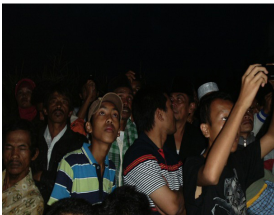
Gambar 7: Tuanku Ismed di Tengah Jama'ah dan Fokus Melihat Bulan