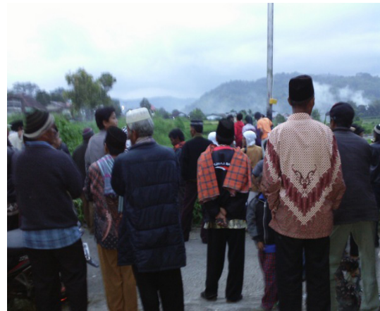
Gambar 5: Jama'ah terus Mengamati Bulan

Buya mulai turun atau mendatangi lokasi melihat bulan dan jama'ah juga sudah turun atau ke jalan ke tempat lokasi di adakannya melihat bulan. Dari anak-anak, remaja, tua muda juga bersama-sama melihat bulan.