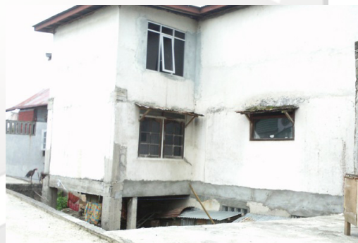
Gambar 1: Sudut Surau Jama'ah Syattariyah

Penulis langsung mengadakan observasi ke lapangan dengan bersama-sama pengikut Tarekat Syattariyah melihat bulan. 26 Dokumentasi dan observasi serta wawancara langsung dilakukan sekaligus oleh peneliti. Di mana ba'da Zhuhur para peziarah sekaligus rombongan untuk melihat bulan mulai berdatangan. Dari gambar tersebut jama'ah mulai berdatangan ke lokasi. Masyarakat Koto Tuo juga ikut bersama-sama menata kendaraan dan suasana lalu lintas. Suasana jama'ah yang sebahagian mulai memasuki area rumah dan sebahagian lagi ada yang berbelanja dan menikmati makanan dan minuman. Sebahagian juga ada yang menjajakan baju. Walaupun sulit dibedakan mana penduduk asli dan pendatang/peziarah untuk melihat bulan. Namun sudah konsentrasi massa sudah terkumpul saja di sekitar ini lokasi tempat melihat bulan.