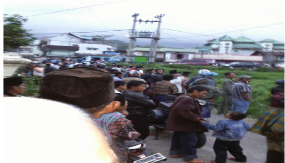
Gambar 4: Buya Tuanku Ismed Mulai Turun

Jama'ah yang berdatangan juga menunggu di lokasi tempat akan diadakannya melihat bulan tersebut. Rumah yang dibelakangi para pengunjung adalah rumah dari cucu Buya Mansur keturunan II dari al-Luma' atau yang populer (Hendri). Peneliti sempat mewawancarai yang bersangkutan yang waktu Buya Ismet ingin melihat bulan sempat bersalaman dengan beliau dengan memanggil mamak mengajak untuk naik ke atas rumah untuk melihat bulan. Namun Tuanku menolak dan di ujung rumah depan tersebutlah tuanku berdiri beserta jamaah lainnya yang sedikit agak ketinggian di banding lainnya. Sedangkan peneliti berdiri di jalan di depan beliau. Sambil mengamati apa yang beliau lakukan dan baca serta komunikasi dengan jama'ah lainnya.