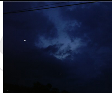
Gambar 6: Gambar yang Mereka Katakan Melihat Bulan

Peneliti berulang-ulang mengambil gambar yang mereka katakan sudah melihat bulan. Memang inilah tradisi bersama-sama melihat bulan menjadi unik. Sebahagian jama'ah mengatakan sudah melihat yang lain belum nampak. Peneliti juga bertanya-tanya pada yang lain. Mana yang bulan mana dia. Tuanku sendiri mengatakan pastikan dulu. Sambil berkemat-kamit baca do'a karena adanya awan hitam yang menutup sehingga tidak terlihat. Namun jama'ah lain mengatakan sudah melihat.