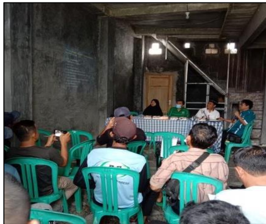
Gambar 2. Proses penyuluhan program pemberian urea

Program pemberian mineral termasuk tindakan pengecekan keberhasilan program adalah sebuah investasi yang akan kembali dalam bentuk ternak yang sehat dan produktif. Program mineral bisa meningkatkan tingkat pembiakan sapi sebesar 2% hingga 4%. Penggunaan mineral organik meningkatkan pertumbuhan pada domba (Adawiah et al. 2006). Respon paling banyak akan terjadi pada ternak muda yang masih bertumbuh. Program pemberian mineral akan menyebabkan lebih sedikit anak sapi yang sakit dan lebih sedikit masalah pneumonia pada saat cuaca panas, akan terjadi tambahan berat 25 hingga 30 pon peranak sapi dalam bobot penyapihan-terkadang lebih.