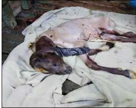
Gambar1. Kelahiran premature yang disebabkan kekurangan micro nutrient

Manfaat dari kegiatan pengabdian ini yaitu meningkatkan pendapatan peternak melalui peningkatan kualitas budidaya dengan pemberian pakan yang cukup dan asupan mineral yang sesuai kebutuhan.