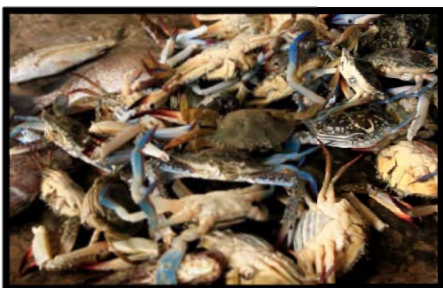
Gambar 6. Rajungan rusak ringan

Kriteria dalam rajungan utuh biasanya warna rajungan segar berwarna