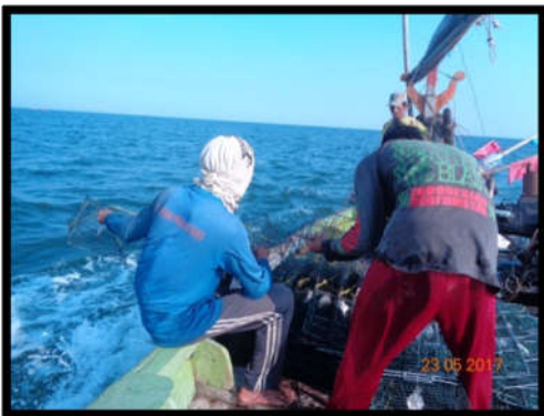
Gambar 3. Proses perendaman alat tangkap bubu

Bubu didaerah Gebang dalam proses immersing sama seperti didaerah lainya yaitu mengalami proses perendaman dengan membiarkan bubu berada di dalam air ( immersing ). Immersing dilakukan selama 4 jam.