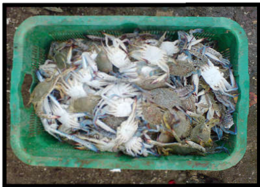
Gambar 5. Rajungan Utuh

Gambar 5 dan Gambar 6 dibawah menunjukkan kerusakan fisik rajungan diantaranya rajungan utuh, rajungan rusak ringan.