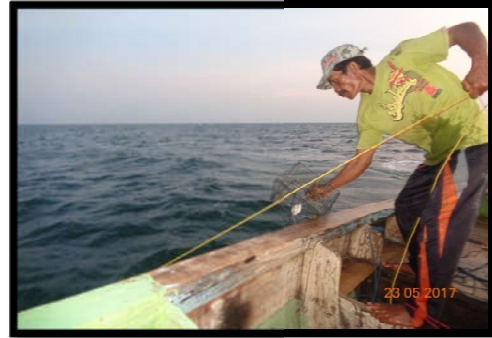
Gambar 4. Pengangkatan hasil tangkapan

lahan. Selanjutnya ikan tangkapan bubu langsung dilepaskan satu per satu dan dimasukkan ke dalam keranjang. Hasil tangkapan yang didapat berupa rajungan, keong, udang alam, ikan dan balakutak.