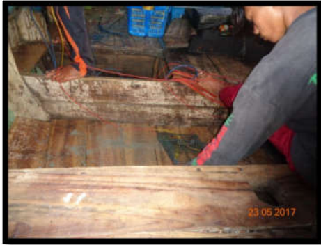
Gambar 2. Penurunan alat tangkap

Operasi penangkapan dilakukan pada dini hari pukul 05.00, sampai difishing ground pukul 07.00 setelah itu perahu mulai maju perlahan-lahan untuk menurunkan bubu lipat. Setting dilakukan selama 2 jam sampai 3 jam. Setting yang dilakukan selama 1 kali.