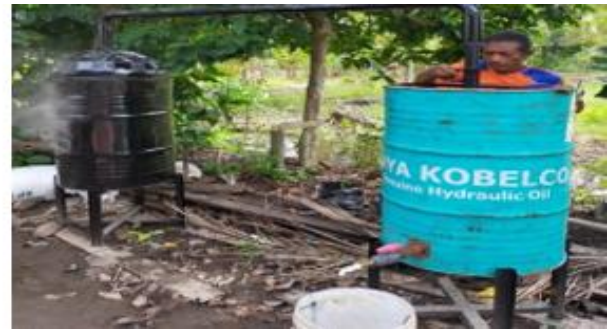
Gambar 5. Anggota Kelompok Tani melakukan Proses Pembuatan Asap Cair