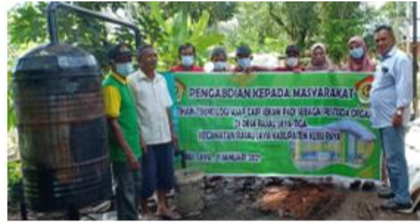
Gambar 4. Tim PKM dan Alat