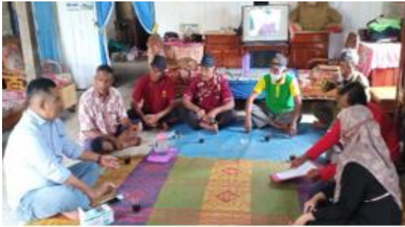
Gambar 3. Penyuluhan dan Pelatihan