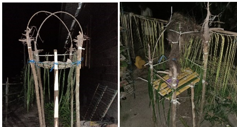
Gambar 2. Ramu Balai