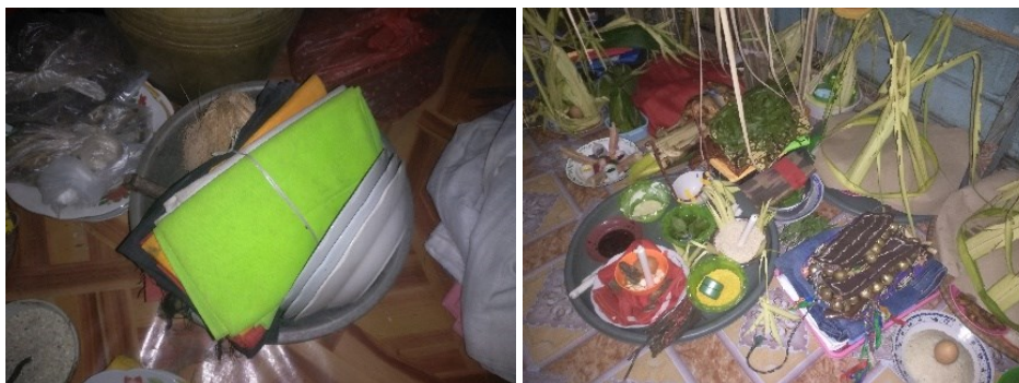
Gambar 3. Ramu Penduduq

Pada suatu kondisi yang sangat darurat Pemeliatn bisa melaksanakan upacara Belian tanpa alat musik, Ramu Penduduq dan Ramu Balai , cukup hanya menggunakan Awir , Dawat Telolo , dupa dan beras untuk tabur saja. Namun upacara seperti ini harus digenapi lagi dengan melaksanakan Belian satu malam lagi dengan Ramu yang cukup, untuk membayar upacara yang darurat tersebut.