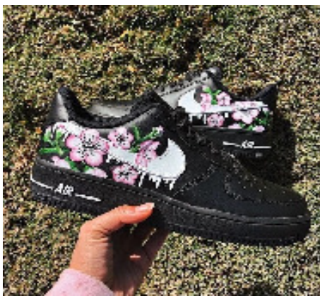
Gambar 3. Contoh Kustomisasi Sepatu Wanita