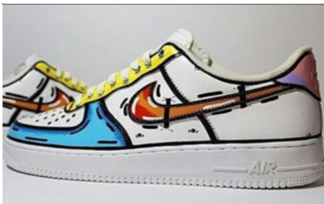
Gambar 2. Contoh Kustomisasi Sepatu Pria