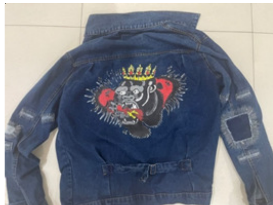
Gambar 5. Contoh Kustomisasi Jaket Pria