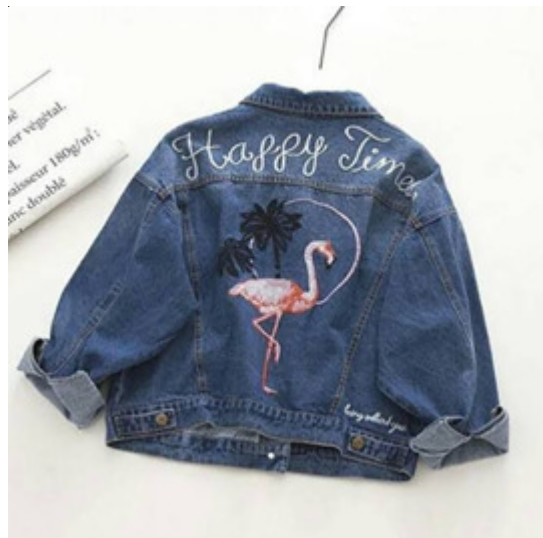
Gambar 6. Contoh Kustomisasi Jaket Wanita