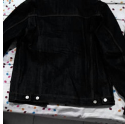
Gambar 4. Contoh Jaket Denim Polos Sebelum Dikustomisasi