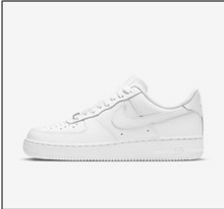
Gambar 1. Contoh Sepatu Sebelum Kustomisasi

yang unik dan orisinal dari ATH Custom ialah konsultasi desain untuk kustomisasi sepatu dan jaket konsumen. Layanan ini memungkinkan konsumen mendapatkan desain yang otentik dan khusus untuk konsumen tersebut.