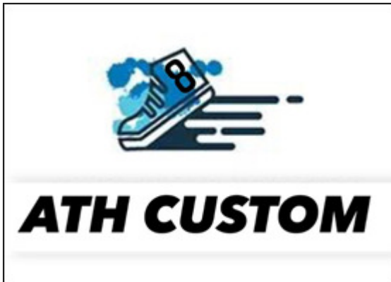
Gambar 7. Logo ATH Custom

Logo yang akan mewakili semangat pelayanan ATH Custom didominasi oleh warna biru, biru tua, dan biru oxford yang dipadukan dengan dalam latar warna putih.