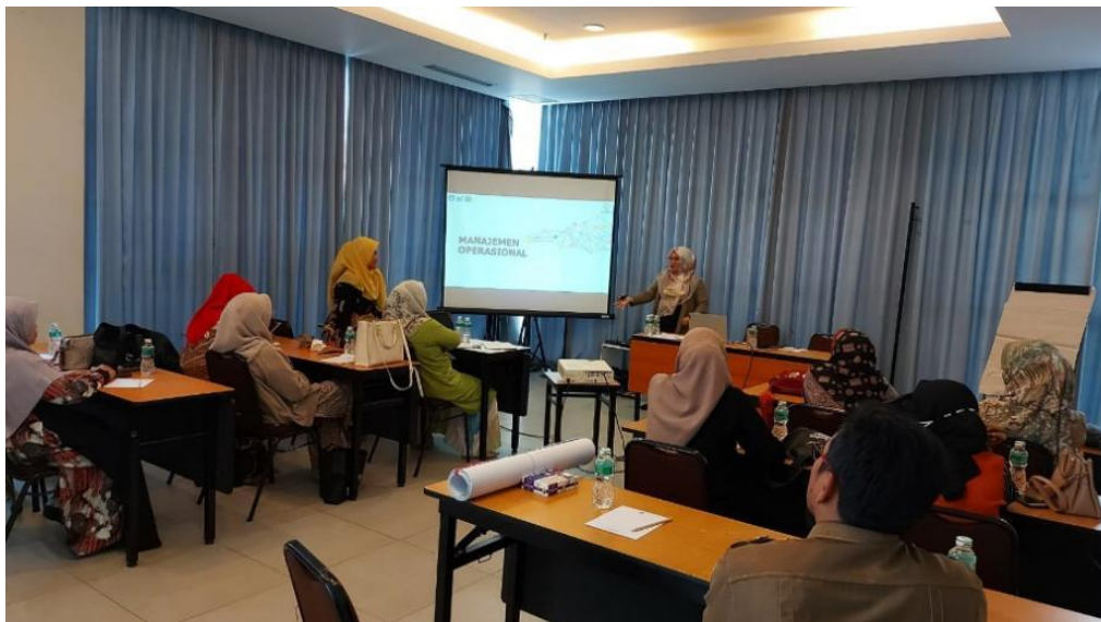
Gambar 3. Penyampaian Materi Manajemen Operasional dan Manajemen Pemasaran oleh Narasumber

Dokumentasi kegiatan pelatihan manajemen operasional dan manajemen pemasaran tersebut dapat dilihat sebagai berikut: