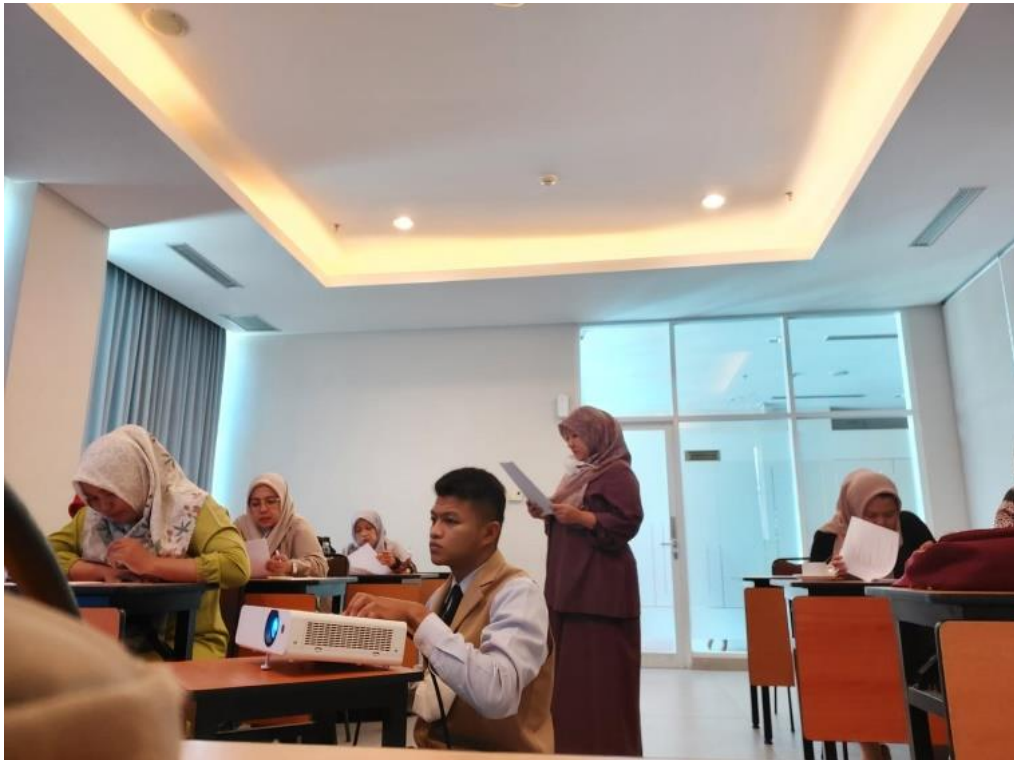
Gambar 4. Peserta Pelatihan Manajemen Operasional dan Manajemen Pemasaran