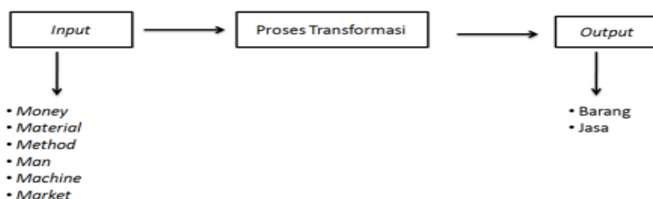
Gambar 1. Proses Manajemen Operasional

Manajemen operasional merupakan kegiatan untuk mengolah sumber daya yang tersedia secara optimal dalam suatu proses transformasi, sehingga menjadi output yang memiliki manfaat lebih dari sebelumnya. Proses manajemen operasional sebagai suatu sistem produktif dapat dilihat pada Gambar 1 sebagai berikut: